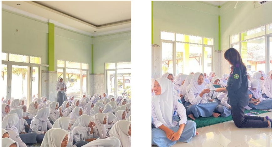
Gambar 4. Diskusi dengan peserta

Sosialisasi dan pelatihan PSN 3M Plus dan ovitrap adalah salah satu upaya yang dilakukan untuk memberikan sosialisasi kesehatan masyarakat sebagai tindakan pencegahan penyakit DBD (Dewi Puspito Sari, Fiqi Nurbaya, Nine Elissa Maharani, Titik Haryanti, Annisa Dewi Suryaningsih, 2024), (Sari, 2020), kendala yang dihadapi dilapangan adalah waktu yang terbatas sehingga waktu interaksi atau diskusi lebih singkat. DBD adalah penyakit yang disebabkan oleh virus dengue yang ditularkan melalui gigitan nyamuk Aedes aegypti . DBD seringkali menjadi masalah kesehatan jika tidak ditangani dengan baik, hingga mengakibatkan kematian. Pelatihan tentang PSN 3M Plus dan ovitrap sangat penting dilakukan di lingkungan sekolah untuk mencegah penyebaran DBD. Kegiatan ini dilaksanakan dengan jumlah siswa yang hadir sebanyak 69 orang. Sebagian besar siswa yang diberikan pelatihan belum pernah mendapatkan sosialisasi tentang ovitrap, sehingga upaya preventif dalam pembuatan teknologi tepat guna sederhana ovitrap pada siswa masih kurang. Setelah dilakukan pelatihan, terlihat bahwa rata-rata pengetahuan siswa meningkat. Dengan meningkatnya pengetahuan siswa terkait upaya pencegahan DBD diharapkan berdampak positif pada sikap dan perilaku siswa dalam pencegahan DBD bagi diri sendiri dan lingkungan sekitarnya (Putri, Widiati and Wayor, 2016), (Ibrahim, Handayani and Ishak, 2025), (Kurniawati, 2020).