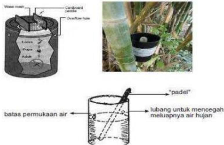
Gambar 2. Gambaran IPTEK Ovitrap

batas kain. Masukkan larvasida dan mendinginkan hingga nyamuk bertelur. Jika nyamuk bertelur di perangkap tersebut, maka akan terlihat bintik-bintik hitam di kain. Itu adalah telur nyamuk yang kemudian akan terbunuh oleh larvasida dan telah dapat digunakan. Pelatihan diberikan meliputi teori yang disampaikan secara ceramah dan diskusi dilanjutkan pelatihan secara praktek. Materi pelatihan meliputi pengenalan alat, prinsip kerja, cara pengoperasian alat dan perawatan alat, penyimpanan teh daun alpukat dan khasiat teh. Partisipasi Mitra dalam pelaksanaan program Mitra akan berpartisipasi aktif dalam setiap kegiatan sosialisasi dan pelatihan. Berikut ini gambar ovitrap sebagai alat sederhana dalam penecegahan DBD :