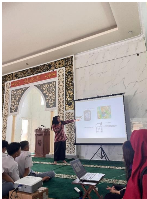
Gambar 3 . Penyampaian materi

Tabel 1. yang disajikan di atas menggambarkan perbedaan dalam tingkat pengetahuan sebelum dan sesudah pelaksanaan sesi pelatihan. Terlihat bahwa rata-rata pengetahuan meningkat dari 55,65 menjadi 85,50. Hasil analisis Uji T berpasangan menunjukkan nilai signifikansi sebesar 0,000, yang menunjukkan adanya perbedaan yang bermakna dalam pengetahuan sebelum dan sesudah pelatihan PSN 3M Plus.