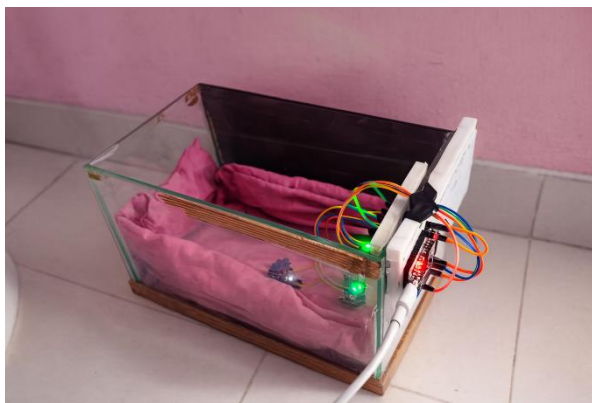
Gambar 3. 1 Prototype Inkubator Bayi

Pada tahap perancangan, sistem monitoring inkubator berhasil dibangun menggunakan kombinasi mikrokontroler ESP32 dan berbagai sensor pendukung. Perangkat dapat terhubung ke WiFi dan mengirimkan data ke aplikasi Blynk secara real-time. Secara desain, sistem ini mampu menampilkan informasi vital yang diperlukan untuk menjaga kondisi bayi prematur, seperti suhu, kelembapan, detak jantung, saturasi oksigen, dan intensitas cahaya.