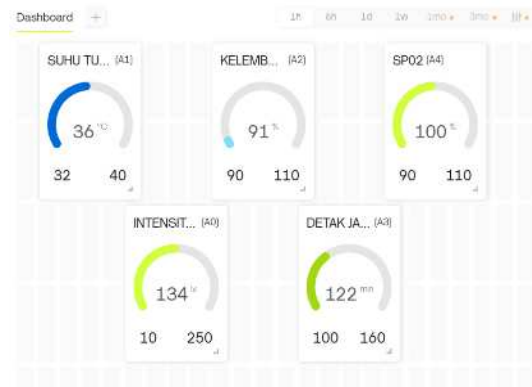
Gambar 3. 2 Dashboard Blynk IoT

Berdasarkan pengujian yang dilakukan terhadap seluruh parameter melalui lima kali pengujian pada masing-masing sensor, termasuk suhu, kelembapan, detak jantung, saturasi oksigen, intensitas cahaya, serta kestabilan pengiriman data ke aplikasi Blynk, sistem menunjukkan performa yang konsisten dan bekerja sesuai rancangan. Seluruh sensor menghasilkan nilai error yang masih berada dalam batas toleransi, sedangkan waktu pengiriman data yang berada pada kisaran 1,1–1,3 detik menunjukkan bahwa koneksi WiFi berjalan stabil. Notifikasi otomatis juga bekerja dengan baik saat parameter melampaui batas aman, dan tidak ditemukan kegagalan pembacaan maupun pengiriman data selama pengujian. Dengan hasil tersebut, dapat disimpulkan bahwa sistem monitoring inkubator bayi yang dikembangkan telah sesuai dengan tujuan perancangan dan layak digunakan sebagai prototipe monitoring real-time