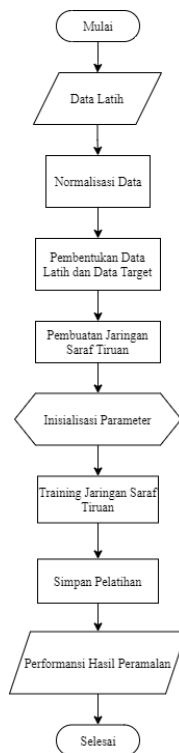
Gambar 1 Flowchart Proses Training

data yang telah dipilih. Pencarian pola dibantu menggunakan aplikasi MATLAB. Pencarian pola dilakukan dengan dengan cara mengolah data masukan dan nilai target. Penentuan pola dilakukan dengan cara menentukan jumlah neuron , epoch , goal , show , momentum constant (mc), dan learning rate (lr). Tahap ini dinamakan proses training . Alur dari proses training dapat dilihat pada Gambar 1.