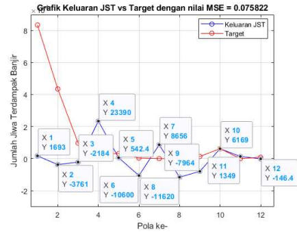
Gambar 4 Grafik Perbandingan Keluaran JST dengan Target Testing Pertama

Hasil persentase error dari peramalan yang telah dilakukan dapat dilihat pada Tabel 7. Nilai error terkecil berada pada Pola ke-10 yaitu 1,296%. Hal ini menunjukkan bahwa hasil peramalan memiliki keakuratan sebesar 98,704%.