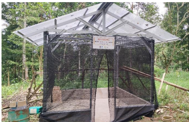
Gambar 3. Rumah kompos

Pembangunan rumah kompos dengan ukuran 3x3 meter dilakukan oleh anggota pengabdian masyarakat, mitra dan pekerja. Bahan-bahan yang dibutuhkan pada pembangunan rumah kompos ini seperti besi ringan, semen, pasir, dan atap. Bahan-bahan tersebut sudah dihitung dan dipersiapkan setelah kegiatan observasi. Jumlah biaya yang dikeluarkan untuk pembuatan rumah kompos adalah sebesar Rp. 4.700.000,-. Biaya yang dikeluarkan terdiri dari biaya alat-bahan dan upah pekerja. Pembangunan rumah kompos dapat dilihat pada Gambar 3. Beberapa kendala yang dihadapi ketika pembangunan rumah kompos adalah cuaca yang kurang mendukung dan waktu pengerjaan yang tidak sesuai rencana. Namun, rumah kompos tetap selesai sebelum evaluasi dan penutupan kegiatan pengabdian.