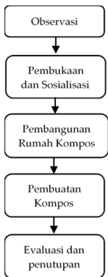
Gambar 2. Diagram alir pengabdian masyarakat

Pelaksanaan kegiatan pengabdian kepada masyarakat ini terlaksana dalam beberapa tahapan kegiatan seperti observasi, pembukaan, sosialisasi dan evaluasi dan penutupan. Detail alur pelaksanaan pengabdian kepada masyarakat dapat dilihat pada Gambar 2.