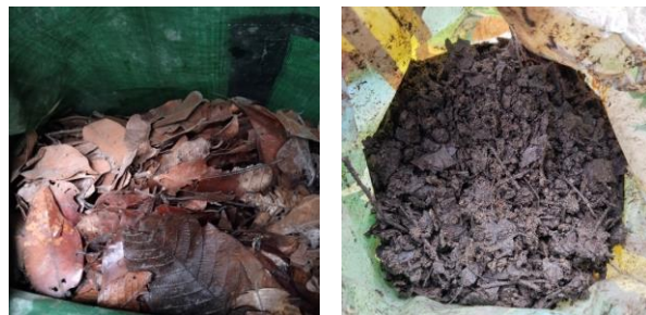
Gambar 4. Produk pupuk kompos

Kendala yang ditemukan ketika pembuatan kompos adalah waktu tunggu yang lebih lama dari umumnya. Hal ini dikarenakan beberapa hal seperti bahan baku yang mengandung air yang cukup sedikit dan lingkungan pembuatan kompos yang kering. Oleh karena pelapukan kompos membutuhkan waktu yang lebih lama.