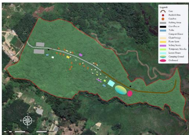
Gambar 1. Peta wilayah Wisata Hutan Meranti (Khoriah & Ulimaz, 2023)

Balikipapan Utara, Kota Balikpapan. Pelaksanaan pengabdian kepada masyarakat ini dilaksanakan selama 4 bulan dimulai pada Februari sampai Mei 2023. Peta wilayah Wisata Hutan Meranti dapat dilihat pada Gambar 1.