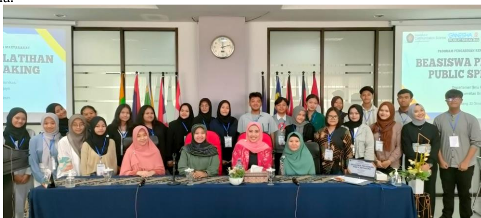
Gambar 4. Foto Bersama

Setelah materi selesai disampaikan, kegiatan pelatihan dilanjutkan dengan sesi tanya jawab. Tiga orang peserta mengajukan pertanyaan mengenai tips menulis materi untuk public speaking dan strategi bagi moderator dan MC untuk menghentikan (memotong) pembicaraan ketika waktu sudah habis. Pemateri memberikan jawaban dengan menunjukkan struktur kalimat dan kata yang digunakan oleh pemateri berdasarkan pengalaman menjadi MC pada sebuah acara formal. Pemateri juga menambahkan bahwa moderator bisa memberikan catatan ketika waktu sudah habis dan MC bisa menyampaikan permohonan maaf terlebih dahulu kepada pihak yang berbicara, dan kemudian menyampaikan maksud dari pemotongan pembicaraan tersebut bahwa waktu telah habis. Setelah sesi tanya jawab dan pemberian penghargaan kepada tiga peserta terpilih, kegiatan pengabdian kepada masyarakat ini diakhiri sekitar pukul 12.10 WIB dengan sesi foto bersama.