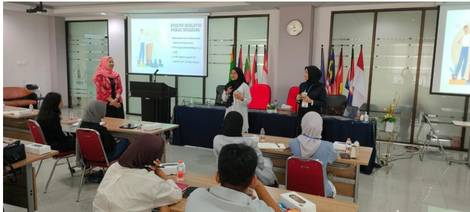
Gambar 3. Peserta Berlatih Bercerita tentang Produk dalam Pelatihan Public Speaking

Guna meningkatkan partisipasi dan keterlibatan peserta, pemateri memberikan kesempatan kepada peserta untuk berlatih berbicara di depan publik. Salah satunya adalah mencoba untuk berbicara atau menceritakan makanan ringan yang mereka pilih kepada peserta lain sebagai audiens.