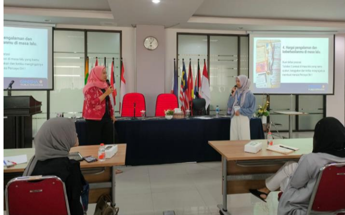
Gambar 2. Peserta Menyampaikan Gagasan mengenai Public Speaking