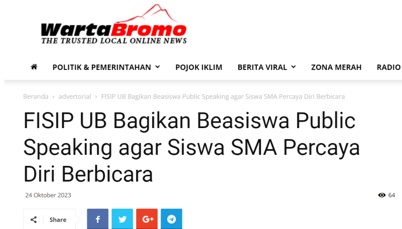
Gambar 5. Pemberitaan Kegiatan Pengabdian kepada Masyarakat

Setelah kegiatan selesai diselenggarakan, tim pengabdian kepada masyarakat menyusun press release kegiatan yang selanjutnya dikirimkan kepada sejumlah media online . Pada tanggal 24 Oktober 2023, berita mengenai kegiatan pengabdian kepada masyarakat ini diterbitkan pada portal berita Warta Bromo dengan judul FISIP UB Bagikan Beasiswa Public Speaking agar Siswa SMA Percaya Diri Berbicara melalui tautan berikut ini https://www.wartabromo.com/2023/10/24/fisip-ub-bagikan-beasiswa-public-speaking-agar-siswa-sma-percaya-diri-berbicara/