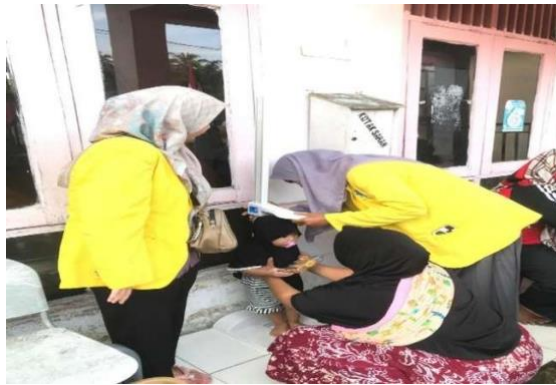
Gambar 4. Pengukuran tinggi dan berat badan

Bahan - bahan yang digunakan untuk membuat stik daun kelor antara lain: daun kelor, tepung terigu, tepung tapioka, telur, penyedap rasa, bawang merah, bawang putih, garam, minyak goreng, daun seledri, margarin, dan baking soda. Sedangkan alat yang digunakan mencakup kompor gas, blender, toples, spatula, wajan, saringan, ampia, piring, standing pouch, dan gas.