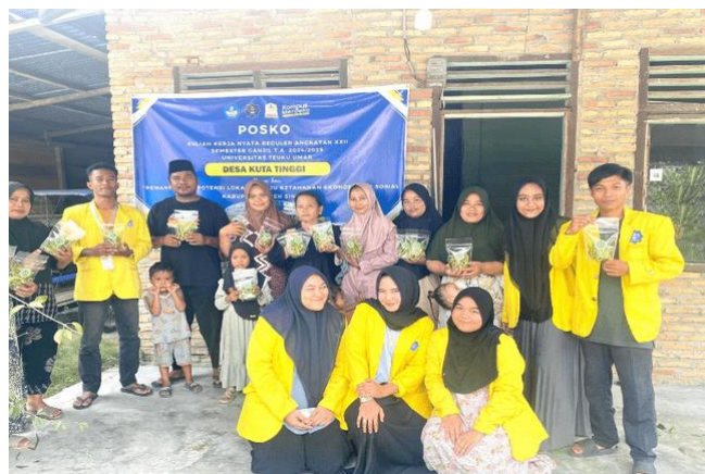
Gambar 6. Bersama kader bidan desa

Kandungan zat gizi daun kelor lebih tinggi jika dibandingkan dengan sayuran lainnya yaitu berada pada kisaran angka 17.2 mg/100 g. Selain itu, di dalam daun kelor juga terdapat kandungan berbagai macam asam amino, antara lain asam amino yang berbentuk asam aspartat, asam glutamat, alanin, valin, leusin, isoleusin, histidin, lisin, arginin, venilalanin, triftopan, sistein dan methionine (Adisty, Vanesa, Wahyuni, & Khairani, 2024).