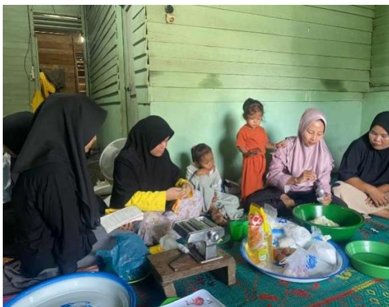
Gambar 2. Proses pembuatan stik daun kelor

Kegiatan pembuatan olahan stick daun kelor dimulai dengan penggunaan bahan dasar daun kelor segar. Daun kelor segar diambil dari rumah tetangga dan kemudian dipilah serta dipisahkan dari tangkainya sebelum dibersihkan dengan menggunakan air mengalir. Setelah itu, daun kelor di blender hingga cair jika perlu tambahkan sedikit air untuk mempermudah proses penggilingan. Kemudian campurkan tepung terigu dan tepung tapioca dalam wadah besar, tambahkan daun kelor yang sudah dihaluskan, lalu masukkan bawang putih halus, garam, margarin, baking soda diaduk rata. Lalu tambahkan telur dan air es sedikit demi sedikit sehingga adonan kalis dan bias dipulung. Kemudian ambil sebagian adona, giling dengan penggilingan hingga pipih. Potong adonan yang sudah pipih sesuai dengan bentuk yang diinginkan bisa menggunakan dengan cetakan stick atau memotong manual dengan pisau. Selanjutnya panaskan minyak goreng dalam wajan, goreng stick daun kelor hingga kuning kecoklatan lalu angkat dan tiriskan. Setelah dingin masukkan dalam kemasan stunding pouch kedap udara agar tetap renyah.