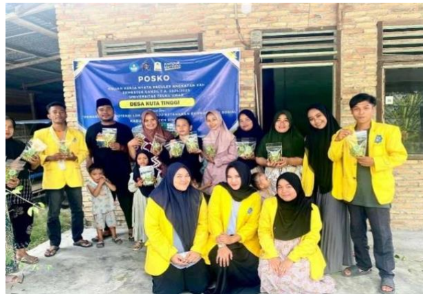
Gambar 5. Pembagian stik daun kelor

Salah satu bagian dari tanaman kelor yang telah banyak diteliti kandungan gizi dan kegunaannya baik untuk bidang pangan dan kesehatan adalah bagian daun. Di bagian tersebut terdapat ragam nutrisi, di antaranya kalsium, besi, protein, vitamin A, vitamin B dan vitamin C. Untuk mendukung pertumbuhan dan perkembangan sesuai usia, anak-anak membutuhkan nutrisi tersebut (Rahayu & Hasibuan, 2023). Stik daun kelor, makanan bergizi dan gurih yang terbuat dari daun kelor segar, menjadi pilihan makanan yang disukai anak-anak dan remaja yang dapat merangsang rasa ingin tahu mereka terhadap tanaman daun kelor. Edukasi kegiatan ini dimulai dengan meminta izin kepada kader posyandu untuk mengikutsertakan anak-anak KKN dalam program posyandu. Selanjutnya, memberikan arahan kepada ibu-ibu tentang pencegahan stunting. Materi penjelasan tentang manfaat daun kelor, baik untuk anak-anak maupun remaja, disampaikan secara rinci. Proses pembuatan stik daun kelor juga diberikan, diikuti dengan tinjauan hasil penyuluhan dan pembagian kepada peserta, disertai dengan sesi foto bersama kader. Penyuluhan ini bertujuan membantu masyarakat memperoleh informasi baru mengenai stunting dan cara-cara mudah mencegahnya melalui pengolahan daun kelor.