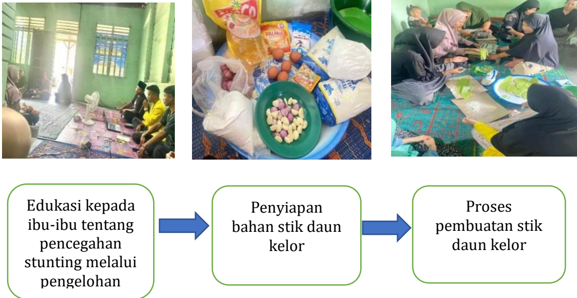
Gambar 1. Bagan alir kegiatan