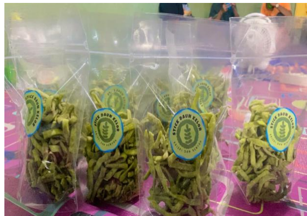
Gambar 3. Produk stik daun kelor siap untuk dikonsumsi

Proses pembuatan stik kelor dilakukan di posko KKN, setelah produk olahan stik daun kelor siap, stik daun kelor ini di bawa ke balai posyandu untuk diberikan kepada anak-anak balita dan remaja, semua anak - anak balita dan remaja diminta untuk mencicipi stik daun kelor yang sudah jadi. Para ibu hamil serta ibu yang menyusui ditanyai tentang rasa stik daun kelor terhadap cita rasa yang dihasilkan. Sekitar 90 % peserta ibu -ibu percaya bahwa mengolah daun kelor itu sangat mudah dan bisa dilakukan di rumah, setiap peserta yang hadir mengatakan bahwa mereka memiliki pengalaman yang sangat positif terhadap pemanfaatan daun kelor.