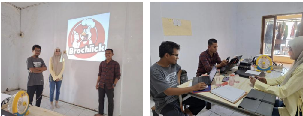
Gambar 1. Dokumentasi Kegiatan Sosialisasi

Kegiatan sosialisasi dilakukan pada Kantor UMKM Brochiick yang berlokasi di jalan Antang Raya No.57, Antang, Kec. Manggala, Kota Makassar, Sulawesi Selatan. Kegiatan sosialisasi dilaksanakan sebagai upaya menyatukan pemahaman antara pemilik dan staf UMKM dengan tim pengabdian terkait rencana pelaksanaan program. Beberapa studi terdahulu menegaskan bahwa tahap sosialisasi berperan krusial sebagai langkah awal bagi UMKM Brochiick untuk memahami strategi yang akan diterapkan (Hamidah Sari & Desty Febrian, 2025). Selain itu, proses ini juga berkontribusi dalam meningkatkan pemahaman serta kesiapan pelaku usaha dalam mengadopsi strategi baru, termasuk dalam konteks penerapan pemasaran digital (Rachmawati & Hariyana, 2023). Dalam pelaksanaan kegiatan ini, tim pengabdian memberikan penjelasan mengenai maksud serta tujuan dari program PKM yang dijalankan. Selain itu, tim juga menyampaikan gambaran mengenai persiapan yang telah dilakukan, rencana kegiatan yang akan dilaksanakan, serta capaian akhir yang diharapkan dari program PKM tersebut.