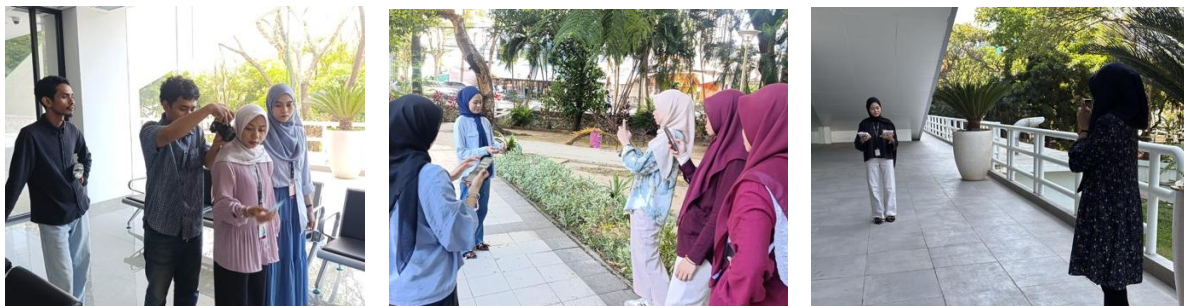
Gambar 5. Dokumentasi Pembuatan Konten Media Sosial

Gambar 4 memperlihatkan tim pengabdian juga melakukan pendampingan terkait pembuatan konten yang berfokus pada pengembangan desain kemasan serta fotografi produk. Gambar 4.a menunjukkan proses pendampingan oleh tim pengabdian dalam pengambilan gambar produk. Gambar ini akan digunakan untuk pengembangan konten di media sosial Instagram. Selain itu, dilakukan pendampingan desain kemasan produk yang diarahkan agar lebih modern, fungsional, dan mampu merepresentasikan identitas merek secara konsisten, sehingga dapat meningkatkan daya tarik visual sekaligus membangun citra profesional UMKM (lihat Gambar 4.b). Melalui pendampingan ini, diharapkan UMKM Brochiick dapat memiliki konten pemasaran yang lebih berkualitas dan berdaya saing dalam menarik perhatian konsumen.