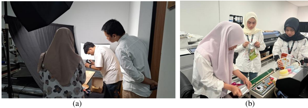
Gambar 4. Dokumentasi Pelaksanaan Pendampingan Pembuatan Konten

Gambar 4 memperlihatkan tim pengabdian juga melakukan pendampingan terkait pembuatan konten yang berfokus pada pengembangan desain kemasan serta fotografi produk. Gambar 4.a menunjukkan proses pendampingan oleh tim pengabdian dalam pengambilan gambar produk. Gambar ini akan digunakan untuk pengembangan konten di media sosial Instagram. Selain itu, dilakukan pendampingan desain kemasan produk yang diarahkan agar lebih modern, fungsional, dan mampu merepresentasikan identitas merek secara konsisten, sehingga dapat meningkatkan daya tarik visual sekaligus membangun citra profesional UMKM (lihat Gambar 4.b). Melalui pendampingan ini, diharapkan UMKM Brochiick dapat memiliki konten pemasaran yang lebih berkualitas dan berdaya saing dalam menarik perhatian konsumen.