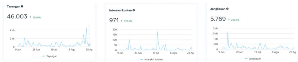
Gambar 7. Metrik Tayangan, Interaksi, dan Jangkauan Instagram UMKM Brochiick

Tahap akhir dari kegiatan PKM ini adalah evaluasi keberhasilan penerapan pemasaran digital pada UMKM Brochiick. Keberhasilan ini diukur dengan menggunakan metrik pemasaran digital seperti jumlah tayangan, jangkauan, interaksi konten, kunjungan dan pengikut. Hasil pengukuran metrik pemasaran digital yang dilakukan selama 3 bulan terakhir di UMKM Brochiick sebagai berikut: