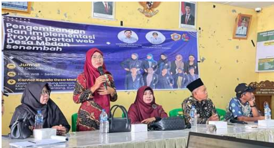
Gambar 3. Fase Pelaksanaan Kegiatan Pada Tahap Pelaksanaan Sosialisasi

Disela-sela kegiatan pelatihan dan saat proses pelatihan telah berakhir, dilakukan pendokumentasian yang bertujuan untuk pembuatan laporan serta sebagai bukti pendukung untuk luaran pelaksanaan kegiatan pengabdian masyarakat.