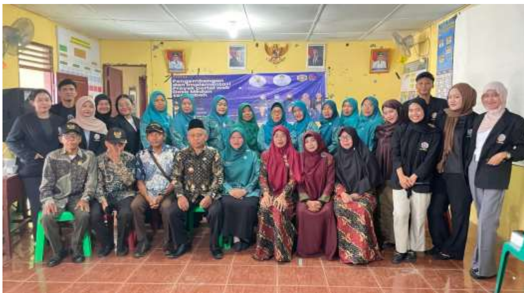
Gambar 5. Kegiatan Dokumentasi Dalam Tahap Pelaksanaan Kegiatan

Disela-sela kegiatan pelatihan dan saat proses pelatihan telah berakhir, dilakukan pendokumentasian yang bertujuan untuk pembuatan laporan serta sebagai bukti pendukung untuk luaran pelaksanaan kegiatan pengabdian masyarakat.