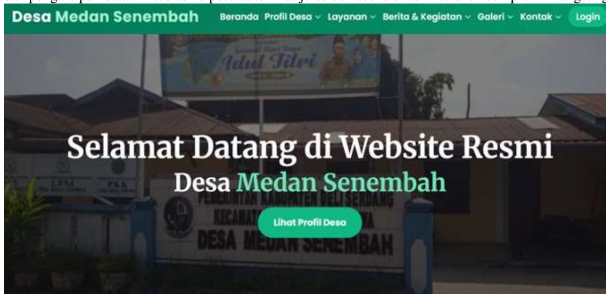
Gambar 6. Tampilan Halaman Utama Portal Desa Medan Senembah

Sesi materi utama mencakup: (1) Filosofi dan urgensi keterbukaan informasi desa, (2) Pengenalan fitur administratif dan cara login ke dashboard portal web desa, dan (3) Praktik langsung unggah konten dan pengarsipan data. Antusiasme peserta terlihat jelas dari sesi diskusi interaktif dan praktik langsung.