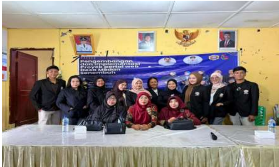
Gambar 2. Tim Pengabdian Masyarakat STMIK Triguna Dharma