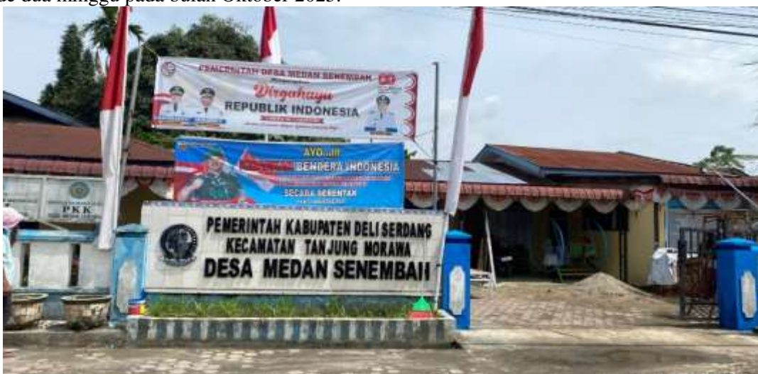
Gambar 1. Lokasi Pengabdian Kepada Masyarakat.

Metode pelaksanaan kegiatan pengabdian kepada masyarakat (PKM) mengenai sosialisasi dan pelatihan penggunaan Portal Web Desa ini dirancang melalui pendekatan edukatif, partisipatif, dan praktis. Seluruh tahapan dilaksanakan di Desa Medan Senembah, Kabupaten Deli Serdang, selama periode dua minggu pada bulan Oktober 2025.