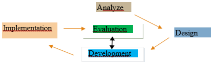
Gambar 1. Desain Penelitian Skema Model ADDIE (Sumber: Sugiyono, 2015) Modifikasi