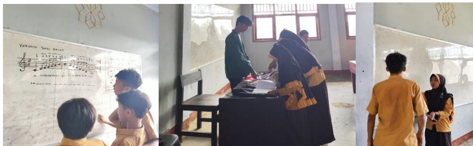
Gambar 2. Guru mendemonstrasikan teknik pernapasan diafragma kepada siswa

Gambar 2 menunjukkan proses guru memberikan contoh langsung kepada siswa mengenai teknik pernapasan diafragma sebagai dasar produksi suara yang baik. Pada dokumentasi tersebut, siswa terlihat berdiri dengan postur yang lebih stabil dan memperhatikan instruksi guru secara terfokus. Aktivitas ini bertujuan membantu siswa menyadari pergerakan otot pernapasan dan membedakan antara pernapasan dada dan diafragma. Situasi pada gambar tersebut juga menggambarkan suasana latihan yang intensif