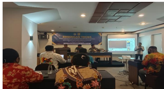
Gambar 1. Pembukaan oleh Narasumber dan Peserta Pelatihan