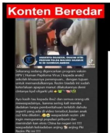
Gambar 1. Konten Beredar

Gambar 1 tersebut memperlihatkan seorang istri anggota Propam Polda Maluku yang sedang mengamuk terkait vaksin yang diberikan kepada anaknya di sekolah. Ternyata dari hasil pemeriksaan fakta, gambar yang beredar dan dicatut tersebut adalah peristiwa yang