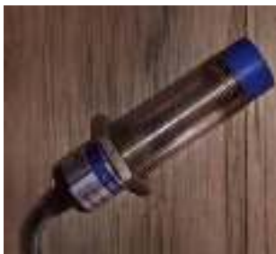
Gambar 1. sensor Proximity LJC 18 A3-B-Z/Bx (Nurrohman, 2019)

Berdasarkan permasalahan diatas maka timbulah ide untuk membuat prototype alat cuci mobil otomatis dan membutuhkan sensor yang dapat digunakan sebagai penanda mobil, sehingga diperlukan analisis penggunaan sensor agar prototype alat cuci mobil otomatis dapat digunakan dengan baik. Sensor yang akan dianalisis adalah sensor Proximity LJC 18 A3-B-Z/Bx seperti pada gambar 1.