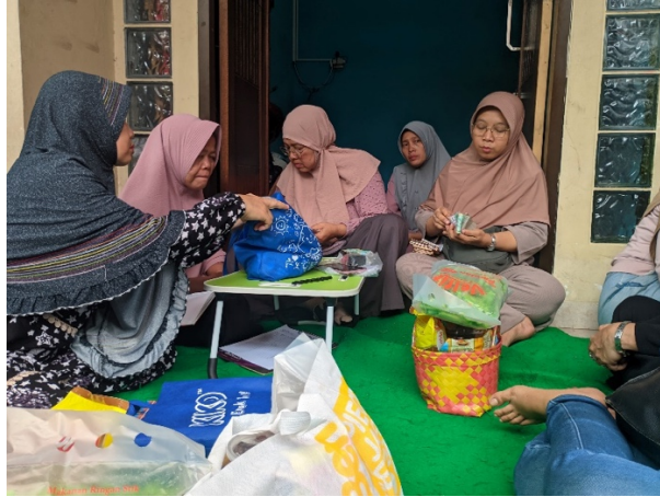
Gambar 3. Para Srikandi Menghitung Hasil Kencleng

“Dari dana sedekah yang terkumpul engga hanya untuk santunan aja, istilahnya gini berapa persen buat program, berapa persen buat operasional Kencleng yang sudah tersebar di warga itu diambil isinya hasil sedekah mereka per satu bulan sekali, biasanya di minggu pertama. Kemudian hasil kencleng dihitung dan disetorkan ke pengurus, lalu pengurus juga menghitung ulang hasil kencleng itu” (wawancara Chici Pudjiastuti 28 Februari 2025).