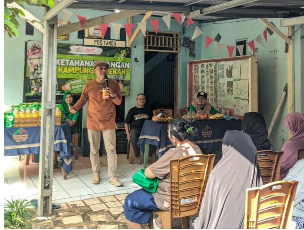
Gambar 2. Pemberian Edukasi Mengenai Pentingnya Bersedekah