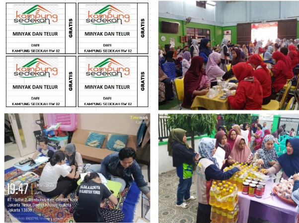
Gambar 1. Kegiatan-kegiatan Program Kampung Sedekah