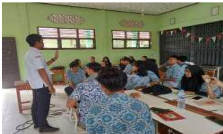
Gambar 2. Proses Pembelajaran

Pelaksanaan Penelitian Tindakan Kelas (PTK) pada hari Selasa, 25 Februari 2025, dari pukul 07.00 WIB hingga 08.20 WIB. Waktu yang dibutuhkan untuk kegiatan siklus I ini mencakup keseluruhan durasi pembelajaran dengan penerapan model Problem Based Learning (PBL) . Subjek yang digunakan dalam penelitian ini terdiri dari 25 peserta didik kelas XI A SMAN 1 Menjalin. Guru mengarahkan peserta didik untuk memfokuskan perhatian mereka pada masalah yang akan dibahas. Guru memberikan empat permasalahan yang harus dipecahkan oleh peserta didik sesuai dengan materi yang telah ditentukan. Kemudian, guru membagi peserta didik menjadi empat kelompok. Guru berkeliling dari satu kelompok ke kelompok lainnya untuk memberikan bantuan dan bimbingan. Selain itu, guru meminta peserta didik menyampaikan solusi yang mereka peroleh dengan informasi dasar serta sumber yang dapat dipertanggungjawabkan. Setelah tahap tersebut, peserta didik diminta untuk mengembangkan hasil diskusi mereka dan menyajikan temuan atau solusi yang telah mereka buat di depan kelas dengan rasa percaya diri. Pada tahap terakhir guru memberikan materi tambahan yang bertujuan untuk menguatkan pemahaman peserta didik serta memberikan evaluasi terkait topik yang telah dibahas.