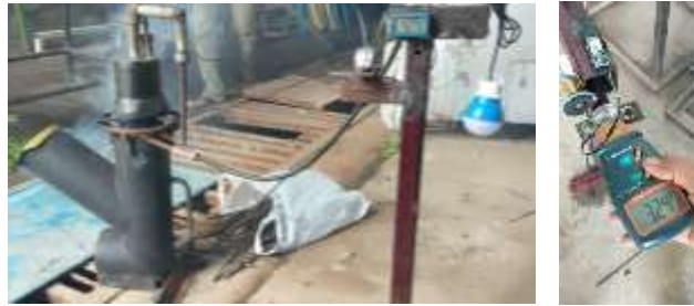
Gambar 3.3 Proses Pengujian Ketel Uap Sampah