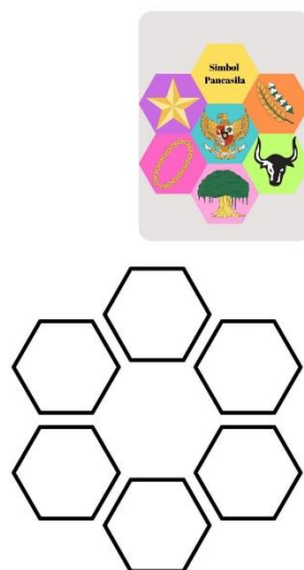
Gambar 3.5. Seni Menempel

Menempel, yang juga dikenal sebagai kegiatan kolase, adalah proses merekatkan berbagai macam bahan seperti kertas, kain, atau benda lainnya ke permukaan datar seperti kertas atau karton. Aktivitas ini memiliki beragam manfaat, khususnya bagi peserta didik, antara lain membantu perkembangan motorik halus, merangsang kreativitas, melatih koordinasi antara mata dan tangan, dan memperkenalkan berbagai warna dan bentuk.