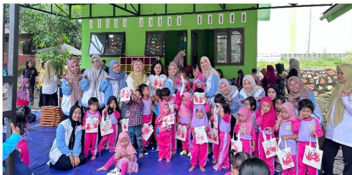
Gambar 3.8. hasil dari men cap ( Finger Painting )