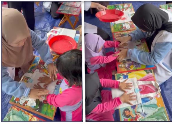
Gambar 3.3. hasil dari men cap ( Finger Painting )

bermanfaat dalam melatih keterampilan motorik halus, merangsang imajinasi, dan menjadi sarana untuk peserta didik dalam mengekspresikan diri.