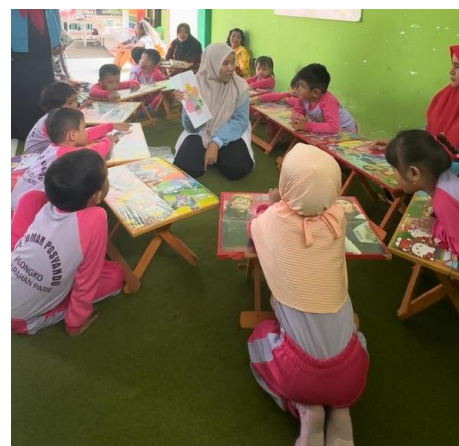
Gambar 3.6. Pelaksanaan Menempel