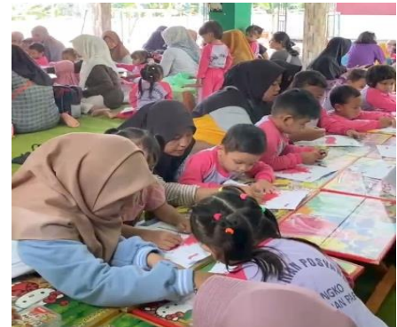
Gambar 3.4. Pelaksanaan kegiatan mewarnai