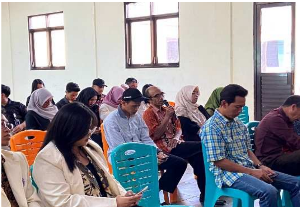
Gambar 2. Sesi Konsultasi Hukum