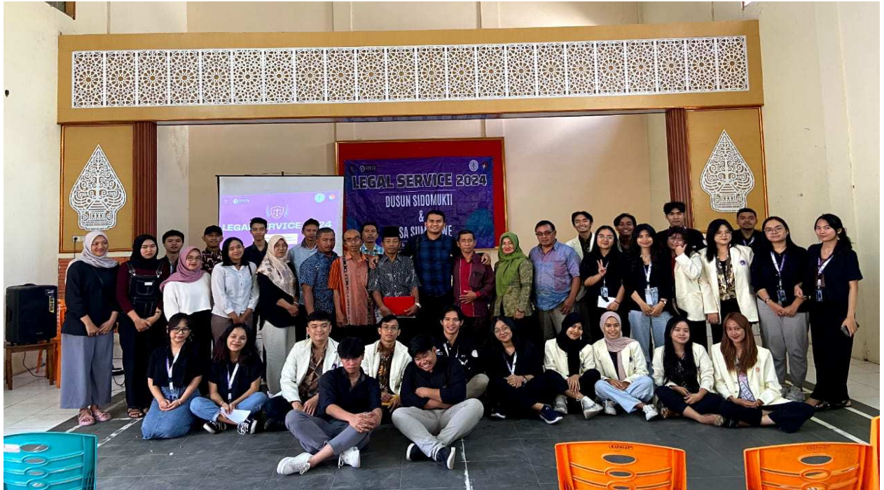
Gambar 3. Masyarakat Desa Sumogawe