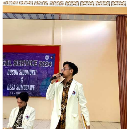
Gambar 1. Sesi Pemaparan Materi