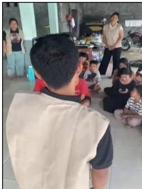
Gambar 2. Pemberian Materi.

Pada tahap kegiatan pemberian materi yang dilaksanakan pada tanggal 4 Juli 2025, peserta dibimbing untuk memahami teknik pembuatan es susu gula aren. Penulis menjelaskan secara runtut mulai dari pengenalan bahan-bahan utama seperti susu, gula aren, dan es, teknik dasar peracikan agar menghasilkan rasa yang seimbang, hingga tips penyajian yang menarik secara visual. Penulis memberikan strategi sederhana dalam menghitung biaya produksi serta cara pemasaran yang mudah diterapkan remaja, misalnya melalui media sosial atau penjualan langsung di lingkungan sekitar. Menurut Kotler & Keller (2012) dalam Beka et al. (2024), pemasaran yang efektif tidak hanya berbicara tentang menjual produk, tetapi bagaimana membangun nilai dan komunikasi dengan konsumen. Oleh karena itu, peserta juga diarahkan untuk memahami pentingnya promosi digital sederhana, seperti membuat konten menarik di Instagram atau WhatsApp yang sesuai dengan tren anak muda masa kini. Hasil dari pemberian materi menunjukkan bahwa peserta mampu memahami langkah-langkah pembuatan minuman kekinian sekaligus memiliki gambaran awal bagaimana produk tersebut dapat dijadikan ide usaha yang bernilai ekonomis.