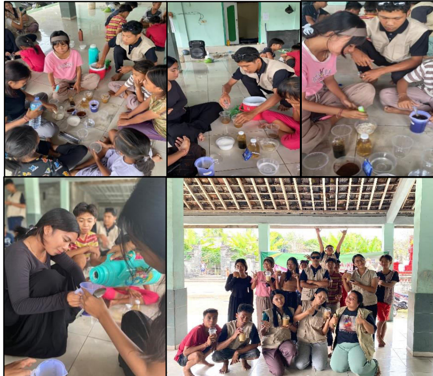
Gambar 3. Praktek Pembuatan dan Finishing .

Pada tahap praktik pembuatan, remaja Karang Anyar dibimbing untuk langsung mencoba meracik es susu gula aren sesuai materi yang telah diberikan, dimulai dari pemilihan bahan berkualitas, penakaran gula aren dan susu yang tepat, hingga teknik penyajian yang menarik agar memiliki daya tarik jual. Kegiatan ini tidak hanya melatih keterampilan teknis, tetapi juga menumbuhkan rasa percaya diri dalam menghasilkan produk yang bernilai ekonomi. Selanjutnya, kegiatan ditutup dengan finishing (penutup) berupa refleksi dan evaluasi bersama, dimana peserta menyampaikan pengalaman serta kesan selama mengikuti pelatihan, sementara penulis menekankan bahwa keterampilan yang diperoleh diharapkan mampu menjadi alternatif kegiatan positif sekaligus peluang usaha, sehingga remaja Karang Anyar dapat teralihkan dari aktivitas negatif, seperti mabuk-mabukan dan perjudian menuju kegiatan kreatif dan produktif yang bermanfaat bagi diri sendiri maupun lingkungan sekitarnya.