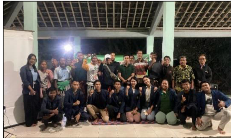
Gambar 1. Observasi Masyarakat.

Sebelum pelaksanaan pelatihan ekonomi kreatif untuk remaja Karang Anyar, yaitu praktik membuat es susu gula aren sebagai ide usaha kekinian, tim KKN melakukan observasi lapangan untuk mengetahui kondisi sosial, potensi sumber daya lokal, serta minat remaja terhadap kegiatan produktif. Hasil observasi menunjukkan bahwa sebagian remaja Karang Anyar masih sering terlibat dalam aktivitas negatif seperti mabuk-mabukan dan perjudian yang berdampak pada rendahnya produktivitas dan motivasi mereka dalam mengikuti kegiatan yang bermanfaat. Hal ini menunjukkan adanya kebutuhan akan wadah yang mampu mengalihkan perhatian remaja dari kegiatan negatif menuju aktivitas positif dan bernilai ekonomi.