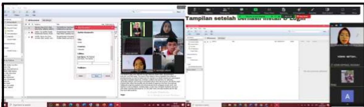
Gambar 2. Pelaksanaan Kegiatan Pelatihan Aplikasi Mendeley

Penggunaan aplikasi Mendeley dalam hal ini akan sangat membantu peserta yang masih berstatus sebagai mahasiswa dalam mengerjakan tugas-tugas kuliah dan atau laporan akhir/skripsi. Pemateri pada pelatihan ini memantau dan memastikan setiap peserta kegiatan sudah mampu melakukan instalasi serta menggunakan aplikasi Mendeley. Pemateri menunjukkan cara membuat sitasi dan menulis referensi dalam karya ilmiah, seperti artikel. Selanjutnya, peserta diminta untuk berlatih dan melakukan share screen agar tim pelaksana kegiatan dapat memastikan bahwa peserta mampu menggunakan aplikasi Mendeley dengan baik dan mengetahui kendala yang dihadapi selama penggunaan aplikasi tersebut. Pengetahuan mengenai sitasi sangat penting karena aplikasi ini akan mengacu pada nama penulis artikel, buku, atau referensi yang akan disitasi dalam karya ilmiah mahasiswa atau penulis (Hanafiah, Sauri, Mulyadi, & Arifudin, 2021). Pelaksanaan kegiatan dapat dilihat pada Gambar 2.