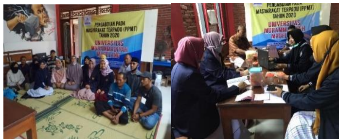
Gambar 1. Penerjunan Mahasiswa PPMT Unimma dan Kegiatan Sosialisasi Koperasi

Kegiatan yang dilakukan adalah untuk menerjunkan mahasiswa ke masyarakat. Kegiatan ini dilaksanakan untuk menguatkan jalinan kemitraan antara Unimma dengan masyarakat Desa Gondang. Selain kegiatan penerjunan, juga sekaligus penjelasan/penyuluhan tentang koperasi, tujuan dibentuknya koperasi, manfaat koperasi, dan Pembentukan koperasi. Kegiatan ini juga dihadiri oleh perangkat desa Gondang, perwakilan warga, anggota Taruna Tani, petugas dari Balai penyuluh pertanian kecamatan Mungkid, dosen pembimbing dan mahasiswa. Kegiatan lain yang dilakukan adalah diskusi lanjutan tentang identifikasi masalah dan penyelesaiannya. Melalui forum ini mendapatkan beberapa masukan untuk perbaikan aktifitas yang harus dilakukan agar permasalahan yang muncul dapat diatasi secara tepat. Hasil yang diperoleh dari diskusi ini adalah langkah kegiatan yang dilakukan selama pengabdian yaitu kegiatan pengaktifan kembali Kartu Tani, pendaftaran BRI Link, Pembentukan koperasi dengan penyusunan struktur kepengurusan koperasi, penyusunan AD-ART koperasi.