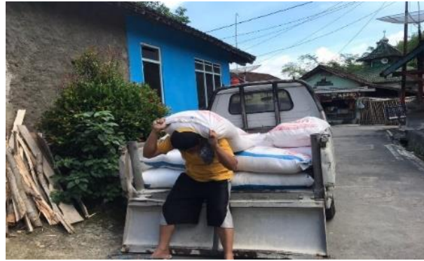
Gambar 6. Proses Pengadaan Pupuk dan Obat-obatan