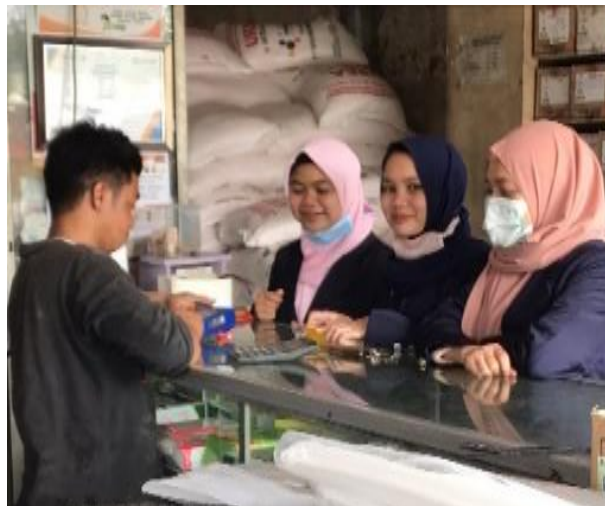
Gambar 5. Kunjungan ke Tempat Pengadaan Pupuk, Obat-obatan dll

Beberapa kegiatan terkait dengan toko penyediaan pupuk, proses pengadaan pupuk dan penyimpanan pupuk bersubsidi dengan menggunakan Kartu Tani pada Gambar 5, 6, dan 7.