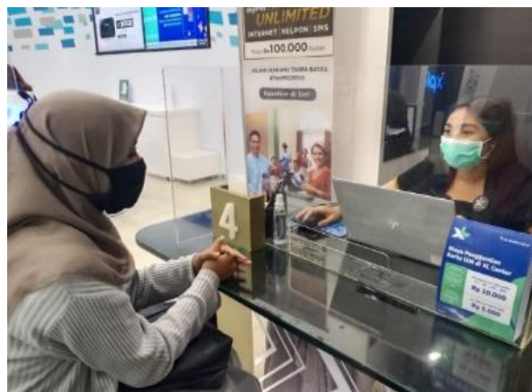
Gambar 11. Konsultasi Persyaratan Pemasangan Router Wifi XI

Kegiatan-kegiatan tersebut merupakan awal pembentukan usaha koperasi. Kegiatan selanjutnya adalah pembentukan kelembagaan koperasi dengan menyusun struktur organisasi koperasi. Upaya yang sudah dilakukan adalah mengaktifkan kembali fungsi “Taruna Tani”. Penyusunan struktur organisasi ini telah memenuhi persyaratan yang ditentukan sesuai dengan