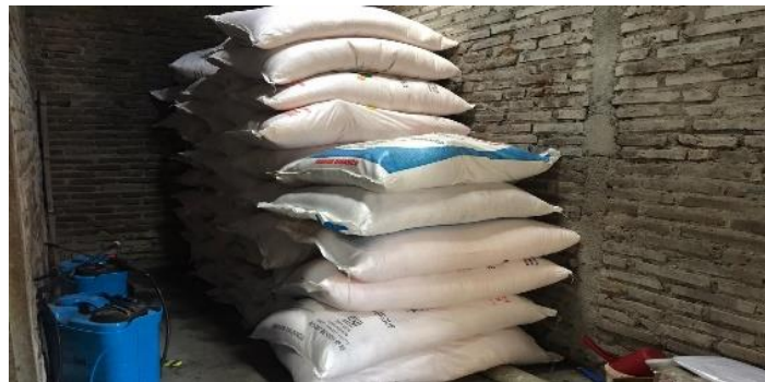
Gambar 7. Gudang Pupuk dan obat-obatan Pertanian

Kegiatan selanjutnya adalah kunjungan ke BRI untuk memperoleh informasi persyaratan pendaftaran warga untuk memperoleh BRI Link. Warga yang memperoleh BRI Link dikelola oleh koperasi dalam hal kemudahan/akses finansial. Kemudahan pembelian pupuk, obat-obatan, peralatan pertanian, dan sebagainya dibantu koperasi melalui akses BRI link. Namun perlu sosialisasi terus menerus agar warga secara optimal dapat menggunakan BRI Link. Upaya lain untuk mempersiapkan usaha koperasi Tani yang lain yaitu pemasangan Router Wifi XL Home di Galeri XL Artos. Kegiatan kunjungan dan konsultasi persyaratan pendaftaran BRI link dan Router Wifi XL terdapat pada Gambar 8, 9, 10 dan Gambar 11.