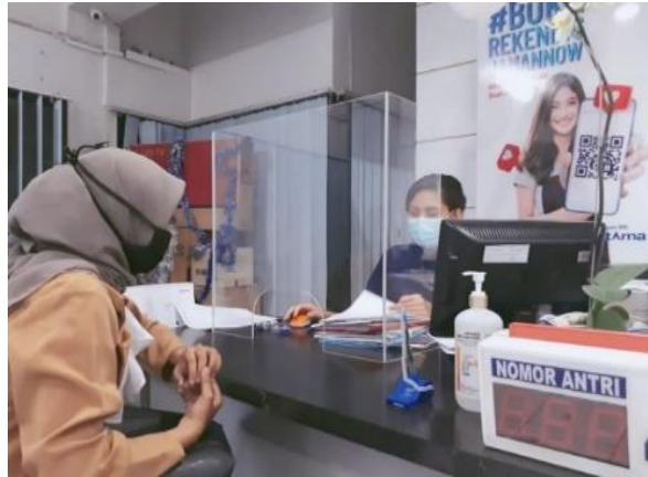
Gambar 9. Konsultasi Persyaratan Pendaftaran BRI Link