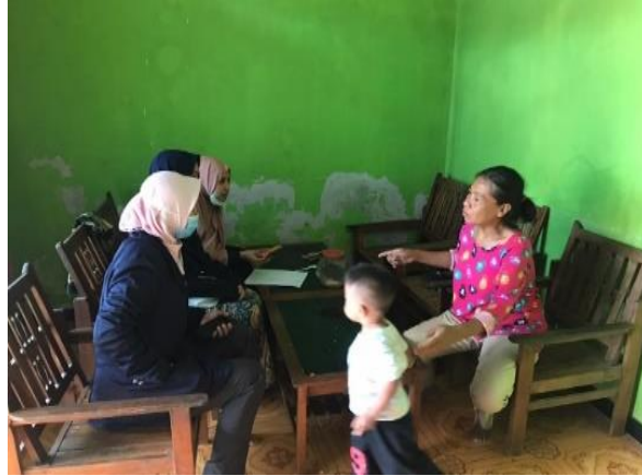
Gambar 3. Kunjungan ke Warga untuk identifikasi Kartu Tani