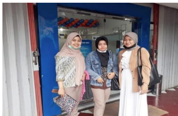
Gambar 8. Kunjungan ke Bank BRI

Kegiatan selanjutnya adalah kunjungan ke BRI untuk memperoleh informasi persyaratan pendaftaran warga untuk memperoleh BRI Link. Warga yang memperoleh BRI Link dikelola oleh koperasi dalam hal kemudahan/akses finansial. Kemudahan pembelian pupuk, obat-obatan, peralatan pertanian, dan sebagainya dibantu koperasi melalui akses BRI link. Namun perlu sosialisasi terus menerus agar warga secara optimal dapat menggunakan BRI Link. Upaya lain untuk mempersiapkan usaha koperasi Tani yang lain yaitu pemasangan Router Wifi XL Home di Galeri XL Artos. Kegiatan kunjungan dan konsultasi persyaratan pendaftaran BRI link dan Router Wifi XL terdapat pada Gambar 8, 9, 10 dan Gambar 11.