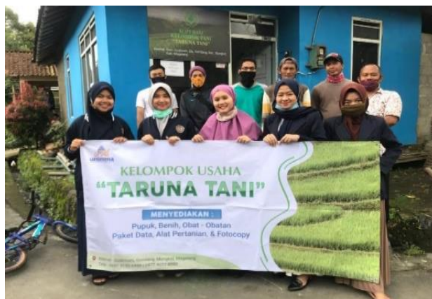
Gambar 13. Terbentuknya Koperasi Kelompok “Taruna Tani”

Pembekalan koperasi juga dilakukan kepada perwakilan warga dan pengurus koperasi yang sudah terbentuk. Pembekalan ini untuk menguatkan kelembagaan dari sisi manajemen, pengelolaan keuangan (akuntansi), pemasaran, produksi, dan sumber daya manusia.