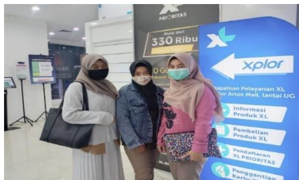
Gambar 10. Kunjungan ke Galeri Xplor Artos Magelang