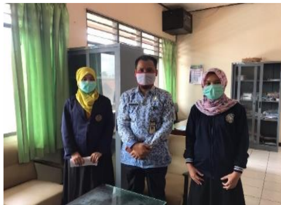
Gambar 2. Kunjungan ke Dinas Koperasi

Kunjungan ke Dinas Koperasi untuk konsultasi dan mendapatkan pendampingan pendirian koperasi terdapat pada Gambar 2.