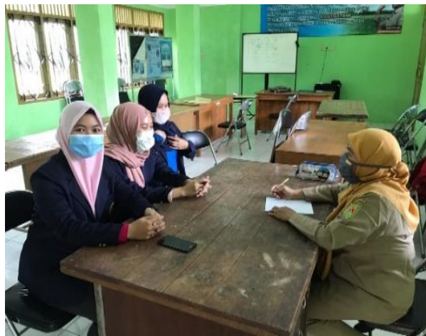
Gambar 4. Konsultasi ke Balai Penyuluh Pertanian

Beberapa kegiatan terkait dengan toko penyediaan pupuk, proses pengadaan pupuk dan penyimpanan pupuk bersubsidi dengan menggunakan Kartu Tani pada Gambar 5, 6, dan 7.