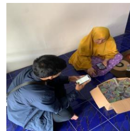
Gambar 3. Pembuatan Sertifikat Halal

Pendaftaran Sertifikat Halal: Tim mengedukasi pemilik mengenai manfaat lebe halal dan membantu pendaftaran akun SIHALAL