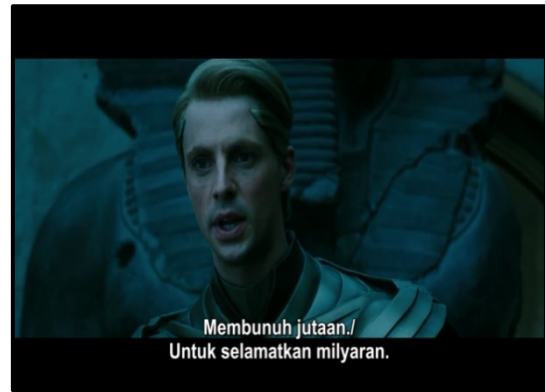
Gambar 2. Pantauan ledakan yang dibuat oleh Ozymandias (Kiri) dan dialog yang menunjukkan tujuan di balik rencana “jahat” Ozymandias (Kanan) (Sumber: Film Watchmen, Zack Snyder, 2009).

Satu rencana lagi tugas yang harus dilaksanakan Ozymandias setelah berhasil mewujudkan rencananya adalah menjaga agar rencana tetap rahasia. Sayangnya, Rorschach sang tokoh protagonis mengetahui rencananya dan berniat untuk membeberkannya kepada masyarakat. Demi mencegah rahasia tersebut bocor dan kembali menimbulkan resiko perang nuklir, Ozymandias dan Dr. Manhattan terpaksa membunuh Rorschach.