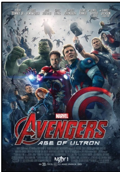
Gambar 5. Poster film Avengers: Age of Ultron, 2015.

Di dalam dialognya, Ultron menunjukkan karakter berpaham utilitarian 2 , di mana untuk mencapai kebahagiaan yang hakiki, pengorbanan harus dilakukan tidak peduli seberapa besar pengorbanan tersebut. Di dalam film, “pengorbanan” yang harus dilakukan ini adalah memusnahkan seluruh umat manusia. Ultron percaya bahwa jika seluruh manusia musnah, tidak akan ada lagi peperangan di dunia ini.