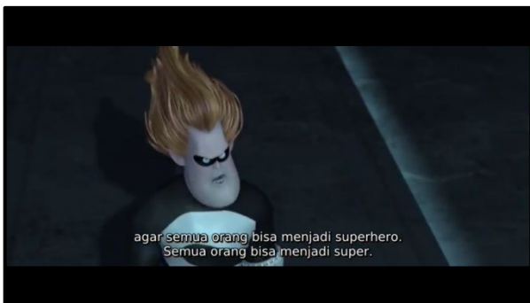
Gambar 4. Dialog Syndrome yang menjelaskan tujuan utama dari rencananya (Sumber: Film The Incredibles , Brad Bird, 2004).

Syndrome, adalah tokoh supervillain dalam film ini. Tokoh ini pada awalnya adalah seorang fans dari Mr. Incredible bernama Buddy Pine. Sayangnya, dia dikecewakan oleh sang idolanya lantaran merasa diabaikan dan dianggap tidak berguna oleh sang idola. Menjawab kekecewaannya, Buddy berniat membalas dendamnya kepada Mr. Incredible dengan cara memusnahkan seluruh superhero menggunakan persenjataan yang dia buat.