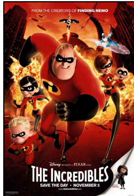
Gambar 3. Poster film The Incredibles 2004 (Sumber: http://www.imdb.com/title/tt0317705/mediaviewer/rm915381504 , diunduh 15 April 2021, 11.45 wib).

The Incredibles Adalah sebuah film animasi bertemakan superhero karya Brad Bird rilisan Pixar Animation Studios. Film ini mengisahkan tentang sebuah keluarga superhero yang tengah menjalani kehidupan