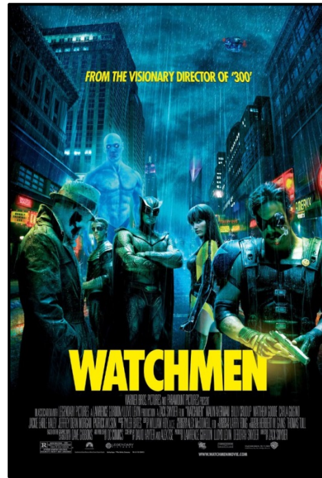
Gambar 1. Poster film Watchmen, 2009. (Sumber: http://www.imdb.com/title/tt0409459/mediaviewer/rm2931438848 , diunduh 15 April 2021, 11.25 wib).

Film karya sutradara Zack Snyder yang didasari dari sebuah komik produksi DC Comics ini menceritakan tentang sekelompok superhero yang telah diberhentikan dari tugasnya. Salah satu di antara mereka, Rorschach, menjalankan investigasi secara diam-diam untuk mencari tahu mengenai kematian salah seorang anggota mereka dan mengungkap rencana tersembunyi di balik Perang Dingin. Kelompok tersebut terdiri dari enam orang superhero , di antaranya adalah The Comedian, Silk Spectre II, Night Owl, Rorschach, Dr. Manhattan dan Ozymandias.