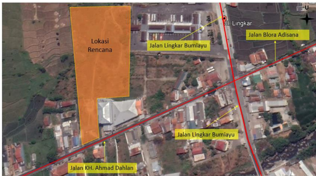
Gambar 1 Ruas Jalan terdampak

Lokasi pembangunan Pasar Seng Bumiayu berada di sisi utara jalan KH. Ahmad Dahlan merupakan jalan kabupaten dengan tipe 2/2 UD dimana lebar jalan 5 meter dengan tiap lajunya 2,5 meter dan lebar bahu 0,5 meter. Untuk jalan Lingkar Bumiayu merupakan jalan nasional dengan tipe 2/2 UD dimana lebar jalan 14 meter dengan tiap lajunya 7 meter dan lebar bahu 1 meter. Sedangkan jalan Blora adisana merupakan jalan kabupaten dengan tipe 2/2 UD dimana lebar jalan 4 meter dengan tiap lajunya 2 meter dan lebar bahu 0,5 meter. Maka dapat ditentukan kapasitas jalan dan tingkat pelayanan jalan terdampak sebagai berikut.