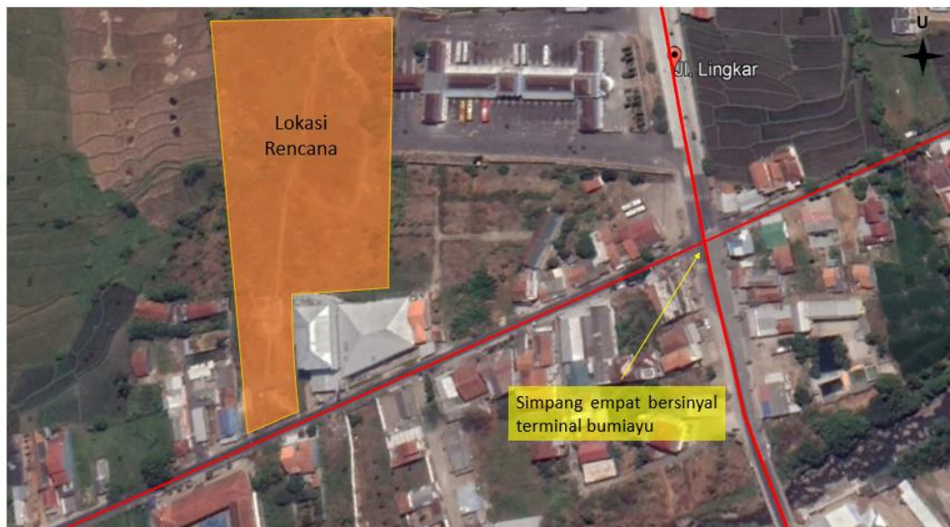
Gambar 2 Simpang Terdampak

Selain ruas jalan, pembangunan Pasar Seng Bumiayu juga berdampak pada satu simpang yang ada di sekitar lokasi kajian, yaitu simpang empat bersinyal terminal bumiayu. Berikut visualisasi simpang empat bersinyal terminal bumiayu.