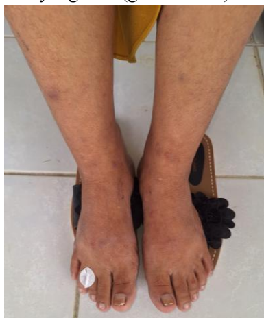
1.c. Ekstremitas Inferior: Tampak patch hipopigmentasi pada tungkai bawah; pada pemeriksaan fisik ditemukan adanya gangguan sensorik pada area lesi tersebut.