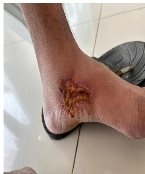
2.c. Ekstremitas Inferior: Lesi hipopigmentasi pada area tungkai bawah; pemeriksaan fisik pada area ini menunjukkan adanya anestesia (mati rasa) terhadap rangsang suhu dan sentuh.