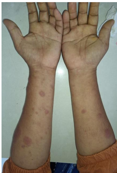
Gambar 1.b. Ekstremitas Superior: Lesi hipopigmentasi multipel yang tersebar pada lengan atas dan bawah, menunjukkan distribusi yang luas (generalisata).