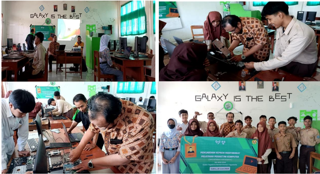
Gambar 2 Dokumentasi Kegiatan

Kegiatan berlangsung sejak Sabtu, 22 Juni 2024 jam 08.00 Sampai dengan selesai di Madrasah Aliyah (MA) IBNU SINA Kuton Tegaltirta Berbah Sleman Yogyakarta.