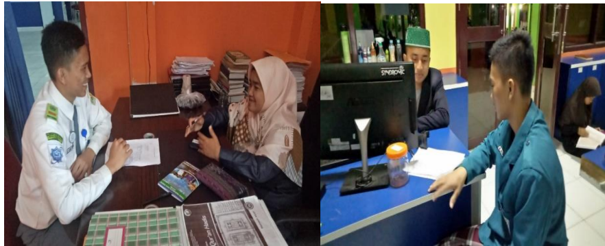
Gambar 2. Proses Berlangsungnya Wawancara

Di dalam program keunggulan keagamaan yang dilaksanakan di MAN Insan Cendekia Jambi terdapat beberapa kegiatan seperti tahfidz qur'an, tafsir hadist, shalat berjemaah, shalat tahajud, shalat dhuha, puasa sunnah, kajian fikih, kultum, pembinaan rohani, pembinaan kitab kuning, pembinaan imam dan pembinaan khatib jum'at . Sesuai dengan hasil wawancara dengan NM, yang menyebutkan kegiatan-kegiatan yang ada didalam program unggulan keagamaan: