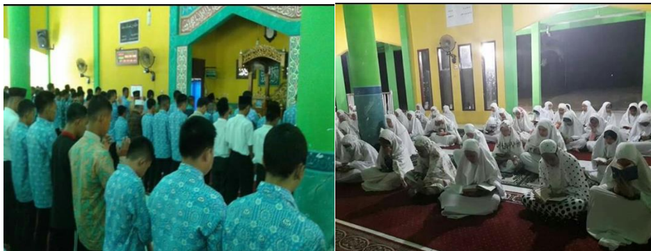
Gambar 3. Kegiatan Keagamaan di MAN Insan Cendekia Jambi

Hal ini diperkuat dengan catatan lapangan peneliti yang melihat siswa-siswi mengikuti kegiatan keunggulan keagamaan dengan khusyuk.