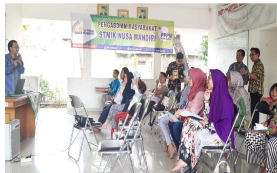
Gambar 4. Penyampaian Materi oleh Tutor

Gambar 3 merupakan suasana ketika kegiatan berlangsung yang berjalan dengan santai dan interaktif, dalam penyampaian materi juga disampaikan dengan bahasa yang sederhana dan mudah dimengerti serta dikemas dengan menarik sehingga peserta dapat menerima dan memahami dengan baik, seperti terlihat pada gambar 4 ketika penyampaian materi berlangsung oleh tutor.