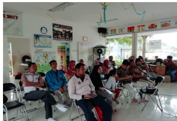
Gambar 3. Suasana Kegiatan Pelaksanaan

Gambar 3 merupakan suasana ketika kegiatan berlangsung yang berjalan dengan santai dan interaktif, dalam penyampaian materi juga disampaikan dengan bahasa yang sederhana dan mudah dimengerti serta dikemas dengan menarik sehingga peserta dapat menerima dan memahami dengan baik, seperti terlihat pada gambar 4 ketika penyampaian materi berlangsung oleh tutor.