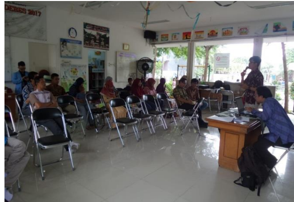
Gambar 2. Pembukaan Kegiatan oleh Tutor

Pada gambar 2 merupakan pembukaan kegiatan yang disampaikan oleh tutor menyampaikan tentang daftar pembahasan selama acara berlangsung.