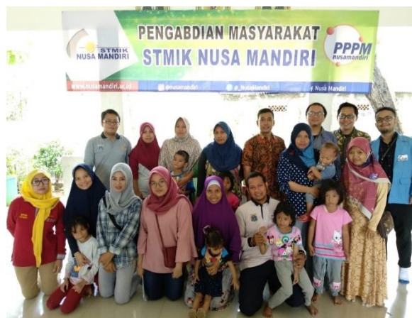
Gambar 7. Foto bersama dengan peserta

Pelatihan ini sangat diapresiasi oleh peserta dilihat dari antusias dan keaktifannya peserta dalam bertanya dan mengikuti pelatihan ini. Pada saat pembelajaran pun banyak para peserta yang antusias dalam bertanya tentang materi yang disampaikan oleh tutor yang diberikan kepada peserta dimana bertujuan untuk mengukur kemampuan para peserta akan materi yang telah diberikan. Kegiatan berjalan lancar sampai akhir acara dan setiap tatap muka ditutup dengan diskusi dan pertanyaan yang berkaitan dengan isi materi pembelajaran. Setelah akhir kegiatan acara ditutup dengan doa kemudian dilanjutkan dengan dokumentasi bersama antara panitia juga peserta seperti terlihat pada gambar 7.