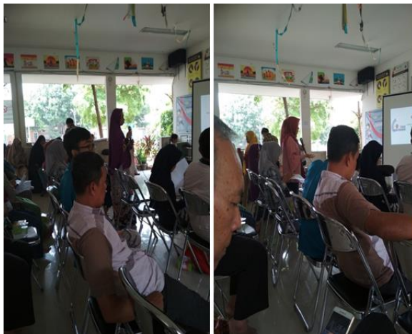
Gambar 5. Sesi Tanya Jawab

Kegiatan berjalan sangat interaktif dengan timbulnya berbagai macam pertanyaan dari peserta seperti bagaimana tips sehat dan aman bertransaksi di internet sampai dengan bagaimana mempromosikan barang di media sosial.