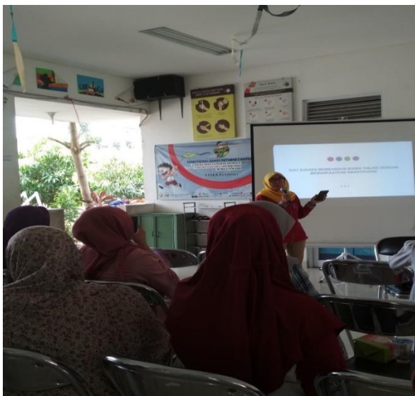
Gambar 1. Sambutan Perwakilan RPTRA Kalideres

Kegiatan ini didukung penuh oleh RPTRA Kalideres, seperti terlihat di hasil dokumentasi[7] pada gambar 1 dimana perwakilan RPTRA Kalideres memberikan sambutan dan menyampaikan bahwa kegiatan ini bermanfaat dan semoga peserta mampu mengembangkan apa yang didapat dari pelatihan ini.