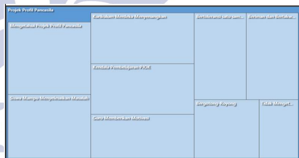
Gambar 3. Hierarchy Chart Proyek Penguatan Profil Pelajar Pancasila

“Selama pembelajaran tidak mengetahui profil pelajar Pancasila, dalam pembelajaran sebelum pelajaran pasti berdoa dahulu. Toleransi dengan menghargai dan saling tolong menolong. Gotong royong untuk tugas cepat selesai. Motivasinya untuk lebih mengerti dan lebih semangat dalam pembelajaran.” [wawancara dari CR, NMKA, BSR, JIG, HAF, AA, FKP, MANZ, BSA, NFYS, MSG, tanggal 30 Januari 2025]. Hal tersebut divisualisasikan sebagai berikut :