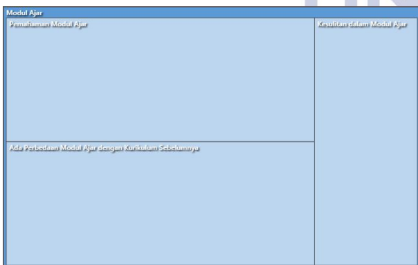
Gambar 2. Hierarchy Chart Modul Ajar

“Modul pembelajaran merupakan instrumen pengajaran yang lebih memahami karakteristik siswa. Modul ajar menggantikan RPP yang ada pada kurikulum sebelumnya. Proses pembelajaran PJOK menggunakan modul ajar menyesuaikan dari yang sebelumnya menggunakan RPP ke modul ajar.” [wawancara dari MF, MZ, MZA, dan AP Kamis dan Jumat, 30 dan 31 Januari 2025]. Hal tersebut divisualisasikan sebagai berikut: