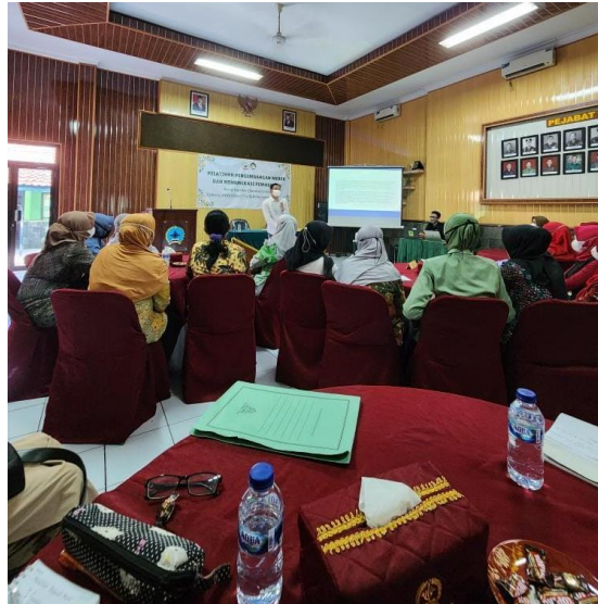
Gambar 3 Suasana Pelatihan Komunikasi Pemasaran

Usaha anggota Persit tersebut yang memiliki modal yang kecil maka dapat dikategorikan Usaha Mikro Kecil Menengah. Oleh karena itu, dengan melihat kecilnya modal yang dimiliki maka peserta belajar untuk memilih saluran yang tepat bagi mereka. Dengan memilih saluran komunikasi yang tepat maka dapat menekan biaya promosinya. Beberapa saluran yang disarankan dalam pengabdian ini adalah melalui media sosial seperti Instagram, TikTok, Facebook, dan WhatsApp.