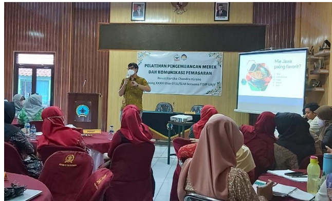
Gambar 2. Suasana Pelatihan Pengembangan Merek

Melalui pelatihan ini, peserta diajak untuk berkenalan dengan konsep merek, arsitektur merek dan unsur merek agar memiliki pemahaman mendasar mengenai merek.