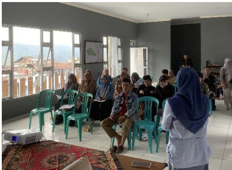
Gambar 2. Sosialisasi tentang Kelompok Usaha Bersama

sektor pertanian. Pelaksanaan program Kelompok Usaha Bersama (KUBE) dapat dilakukan melalui sosialisasi kepada masyarakat menggunakan berbagai media informasi, seperti media elektronik, media cetak, serta komunikasi langsung (Tami Astari Zulkarnain et al., 2021). Dijelaskan beberapa manfaat dari pembentukan KUBE, yaitu dapat mendorong berkembangnya kerja sama di antara anggota KUBE dan masyarakat sekitar, mengembangkan diversifikasi produk pertanian, meningkatkan dorongan sosial dalam KUBE maupun dengan masyarakat, serta mendorong peningkatan keterampilan dalam pemecahan masalah. Tim pengabdian menjelaskan bahwa KUBE dapat menjadi komunitas yang dapat membuat sektor pertanian terkelola dengan baik melalui transfer ilmu, pengetahuan, dan pelatihan-pelatihan yang diajarkan dalam komunitas tersebut, sehingga sektor pertanian dapat berkembang dengan berkelanjutan yang pada akhirnya dapat memenuhi kebutuhan primer, yaitu sandang, pangan, dan papan, pendidikan, serta kesehatan (Rindyah, 2017).