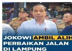
Gambar 2 Contoh Postingan meme di grup MCI