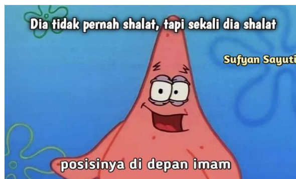
Gambar 6 Contoh meme sindiran