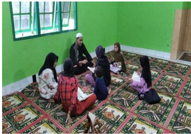
Penerapan Sam'iyah Syafahiyah

Mayoritas murid TPQ Annur diberikan drill pada iqro 3 karena iqro 3 terfokuskan pada Panjang pendek, tasydid, ketepatan membaca, dan pembiasaan pengucapan huruf, para murid diinstruksikan untuk mendengarkan terlebih dahulu bacaan guru, kemudian para murid menirukan bacaan guru, murid mengulangi bacaan guru tidak terbatas, dalam artian murid mengulangi bacaan guru hingga bacannya benar dari sisi Panjang pendek, tasydid, ketepatan pengucapan (makhorijul huruf).