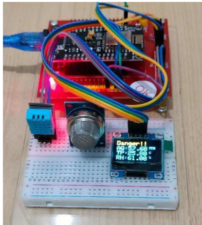
Gambar 2. Alat Saat Menyala dan Menampilkan Data pada Layar LCD

hari dilakukan pada 2 waktu (siang, dan sore), dan dilakukan masing-masing selama 30 menit.