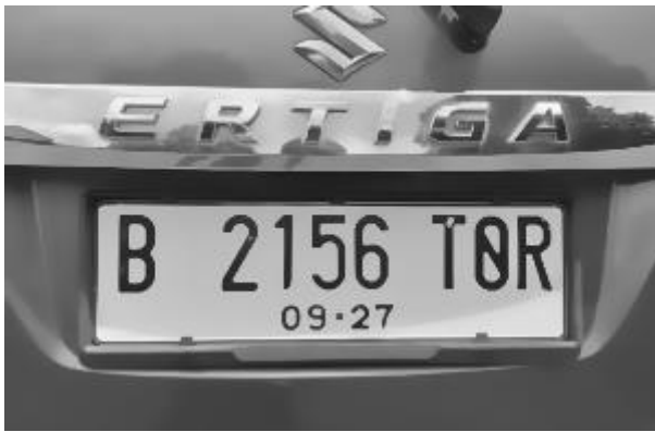
Gambar 3. Citra Grayscale

Mengkonversi citra RGB ke Grayscale dengan menggunakan cv2.COLOR_BGR2GRAY untuk mengubah citra dari warna RGB (standar OpenCV) menjadi Grayscale .