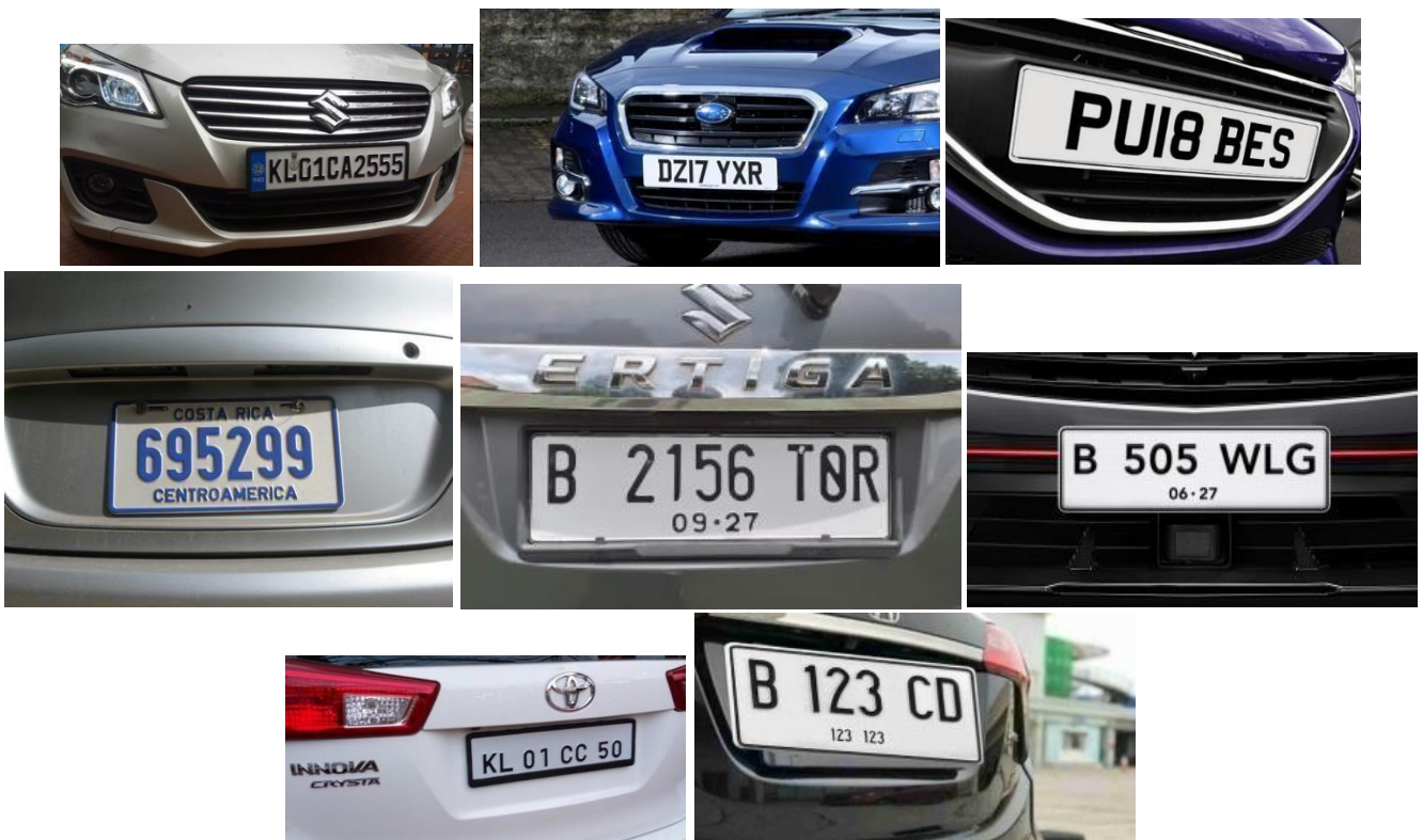
Gambar 2. Input image untuk citra uji, [ https://www.kaggle.com/datasets/andrewmvd/car-plate-detection ]

Pada tahap ini dikumpulkan citra uji yang berupa plat kendaraan dari berbagai sumber seperti yang terlihat pada Gambar 2. Pada penelitian ini dataset bersumber dari Kaggle dengan berbagai kondisi pencahayaan dan sudut pengambilan gambar. Fungsi cv2.imread dalam library OpenCV digunakan untuk membaca gambar dari file. Fungsi ini mengembalikan sebuah objek yang merepresentasikan gambar yang dibaca. Sedangkan cv2.imshow adalah sebuah fungsi dalam pustaka OpenCV yang digunakan untuk menampilkan gambar.