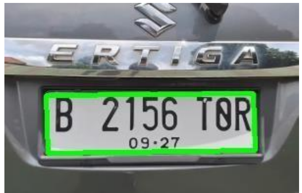
Gambar 6. Citra Deteksi Canny

Untuk menghasilkan citra kontur yang menyoroti karakter pada plat kendaraan, dapat digunakan fungsi findContours seperti yang terlihat pada Gambar 6. Untuk ekstraksi dan pengenalan karakter digunakan metode Tesseract OCR ( Optical Character Recognition ) supaya karakter pada plat kendaraan dapat teridentifikasi, hasilnya dapat dilihat pada Gambar 7.