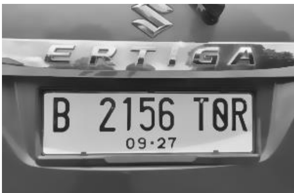
Gambar 4. Citra Noise Filtering

Pada tahap ini diterapkan noise filtering pada citra uji untuk menghilangkan atau mengurangi noise yang mungkin terjadi selama pengambilan citra uji atau pada saat pengolahan citra. Ada beberapa metode yang dapat digunakan untuk melakukan noise filtering , pada penelitian ini digunakan filter Bilateral . Pemilihan filter ini memiliki kemampuan unik untuk mempertahankan tepi ( edges ) sambil menghaluskan area yang tidak mengandung tepi. Ini sangat penting dalam pengolahan gambar pelat kendaraan di mana tepi karakter perlu dipertahankan untuk deteksi dan pembacaan karakter yang akurat. Filter bilateral mengurangi noise tanpa mengaburkan tepi, yang sangat berharga untuk pengenalan karakter optik (OCR). Hasil citra setelah diterapkan fungsi cv2.bilateralFilter terlihat pada Gambar 4.