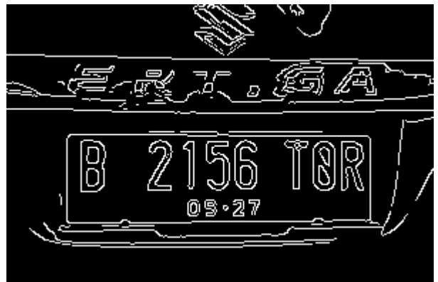
Gambar 5. Citra Deteksi Canny

dan Computer Vision sehingga langkah selanjutnya diterapkan fungsi algoritma canny yaitu cv2.Canny untuk mendeteksi tepi.