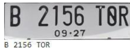
Gambar 7. Output berupa deteksi citra plat kendaraan dan karakter yang teridentifikasi

Untuk menghitung persentase keberhasilan deteksi plat kendaraan bermotor digunakan rumus seperti yang dituliskan pada persamaan 2.