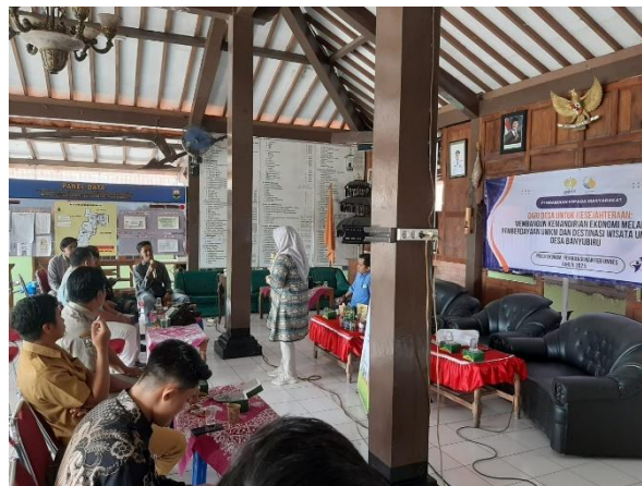
Gambar 4. Tanya Jawab dan Pendampingan Pelatihan

Gambar 3 menunjukkan kegiatan pendampingan yang dilakukan setelah diadakan pelatihan. Pendekatan yang digunakan adalah mentoring individu dan kelompok, yang meliputi beberapa hal, misalnya bimbingan pembuatan produk, pendampingan manajemen usaha untuk membantu peserta UMKM mencatat transaksi keuangan, menghitung biaya produksi, dan menentukan harga jual, pemasaran kolektif dengan cara membentuk komunitas untuk memasarkan produk secara bersama-sama dan memperluas jaringan pasar. Hasil pendampingan yaitu beberapa peserta mulai aktif memasarkan produk melalui media sosial dan memperoleh pelanggan tetap dan terbentuk komunitas wirausaha yang menjadi wadah untuk berbagi pengalaman dan pemasaran yang kolektif. Pendampingan yang dilakukan secara intensif ini membantu peserta dalam mengatasi hambatan praktis. Pembentukan komunitas terbukti meningkatkan semangat belajar bersama dan memperluas jangkauan pemasaran.