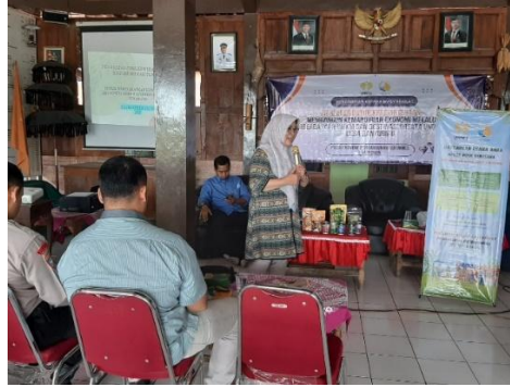
Gambar 3. Pelatihan Penguatan Jiwa Kewirausahaan

Gambar 3 menunjukkan kegiatan pendampingan yang dilakukan setelah diadakan pelatihan. Pendekatan yang digunakan adalah mentoring individu dan kelompok, yang meliputi beberapa hal, misalnya bimbingan pembuatan produk, pendampingan manajemen usaha untuk membantu peserta UMKM mencatat transaksi keuangan, menghitung biaya produksi, dan menentukan harga jual, pemasaran kolektif dengan cara membentuk komunitas untuk memasarkan produk secara bersama-sama dan memperluas jaringan pasar. Hasil pendampingan yaitu beberapa peserta mulai aktif memasarkan produk melalui media sosial dan memperoleh pelanggan tetap dan terbentuk komunitas wirausaha yang menjadi wadah untuk berbagi pengalaman dan pemasaran yang kolektif. Pendampingan yang dilakukan secara intensif ini membantu peserta dalam mengatasi hambatan praktis. Pembentukan komunitas terbukti meningkatkan semangat belajar bersama dan memperluas jangkauan pemasaran.