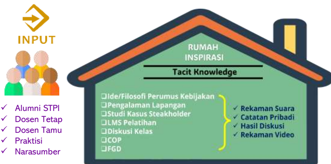
Gambar 2. Input Tacit Knowledge

Pendokumentasian Tacit Knowledge yang masih berupa bahan mentah ditampung dulu semua dalam sebuah wadah untuk memudahkan memilih dan memilah mana yang akan dibuat AI nya sesuai dengan kebutuhan dan urgensinya. Siapapun boleh memberikan sumbangsih Tacit Knowledge yang dimilikinya, tentu saja yang memiliki lebih banyak pengalaman kerja dan permasalahan yang pernah ditangani.