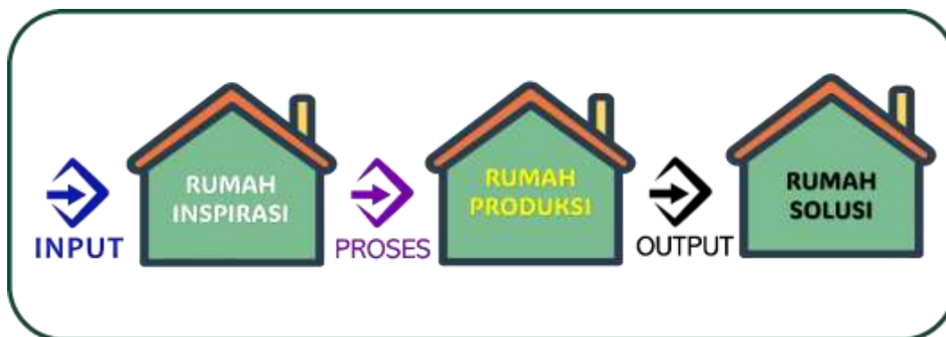
Gambar 1. Proses Pendokumentasian Tacit Knowledge

Dalam pendokumentasian Tacit Knowledge dilakukan melalui 3 tahapan yaitu input, proses dan output, seperti dalam began berikut :