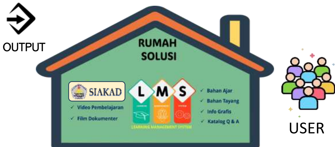
Gambar 4. Proses Akhir Pendokumentasian

Setelah proses digitilisasi Tacit Knowledge menggunakan AI menjadi dokumen pengetahuan dan bahan pembelajaran, selanjutnya agar output tersebut bisa dimanfaatkan oleh semua pihak yang membutuhkannya maka perlunya sarana semacam Rumah Solusi yang berisi kumpulan-kumpulan dokumen Tacit Knowledge yang sudah dibuat dalam berbagai bentuk. Menyusun LMS ( Learning Management System ) yang menampung seluruh dokumen Tacit Knowledge yang sudah terdigitalisasi dalam bentuk video pembelajaran, film dokumenter, bahan ajar, bahan tayang, info grafis serta katalog Q & A yang memungkinkan menampung Tacit Knowledge baru yang belum ada.