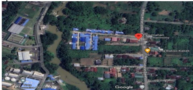
Gambar 1 Lokasi Penelitian

Metode penelitian yang digunakan adalah metode kuantitatif yaitu suatu metode penelitian yang digunakan untuk mengumpulkan data numerik atau data berupa angka, sehingga hasil penelitian dapat diukur secara statistik. Dari data yang didapat dilakukan analisis Net Present Value (NPV), Internal Rate of Return (IRR), Payback Period (PBP), dan Break Even Point (BEP). Analisis dilakukan dengan mempertimbangkan layak atau tidaknya investasi pada proyek dari aspek finansial, jumlah unit yang terjual, titik impas, dan waktu yang didapat. Penelitian ini dilakukan pada proyek pembangunan perumahan Citra Harmony Tanjung Morawa yang berlokasi di Jalan Bandar Labuhan Bawah, Kecamatan Tanjung Morawa, Deli Serdang. Bagan alir penelitian dapat dilihat pada Gambar 2.