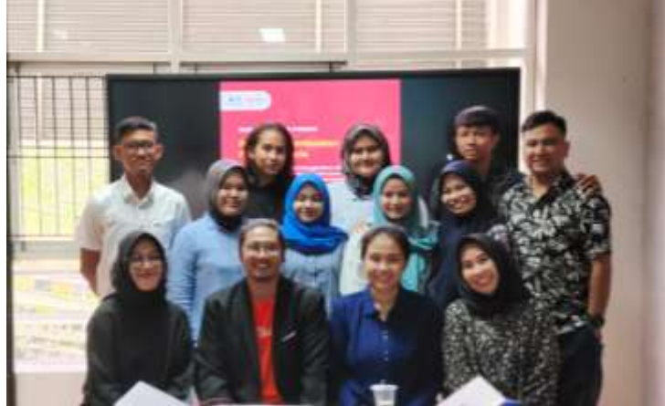
Gambar 6 Penutupan Pelatihan

Pelatihan penyusunan proposal Bisnis ini telah berjalan dengan baik dan lancar. Dalam pelaksanaannya, Menggunakan platform Zoom untuk mengakomodir peserta yang berhalangan hadir secara offline . Peserta sangat antusias dan bersemangat dalam mengikuti kegiatan pelatihan. Peserta dapat memahami tata cara penyusunan proposal Bisnis beserta mengadaptasi Teknologi melalui toko online untuk memasarkan produk. Setelah pelatihan ini, peserta mulai merancang ide Bisnis serta proposal Bisnis untuk digunakan dalam mencari pendanaan Bisnis. Pengetahuan tentang pemanfaatan toko online untuk memasarkan produk juga meningkat sehingga diharapkan dapat membantu peserta dalam menjangkau pasar yang lebih luas, tidak hanya di kota Balikpapan saja.