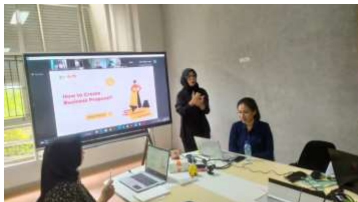
Gambar 2 Penyampaian Materi

Kegiatan pelatihan dimulai pada Pukul 10.00 WITA, dimulai dari registrasi peserta, kemudian dilanjutkan dengan penyampaian materi penyusunan proposal Bisnis dan membangun toko online dengan dibantu menerjemahkan dalam Bahasa isyarat oleh perwakilan Juru Bahasa Isyarat (JBI) Balikpapan. Kondisi penyampaian materi dapat dilihat pada gambar 2.