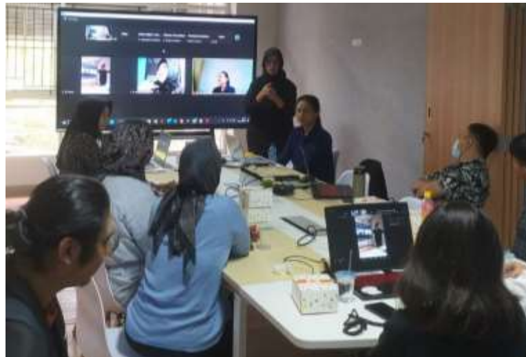
Gambar 3 Sesi Diskusi selama Pelatihan Hybrid

Pelaksanaan diskusi dilaksanakan pada akhir sesi penyampaian materi. Diskusi hybrid berjalan dengan sangat aktif. Peserta pelatihan baik peserta pelatihan online dan peserta pelatihan offline sangat antusias dengan materi yang dibawakan serta berkonsultasi terkait ide Bisnis, brand, tips menjalankan usaha dengan modal minim, cara menarik perhatian investor, serta cara agar toko online ramai dikunjungi oleh calon pembeli. Proses komunikasi pada sesi diskusi juga dibantu oleh perwakilan Juru Bahasa Isyarat (JBI) Balikpapan.