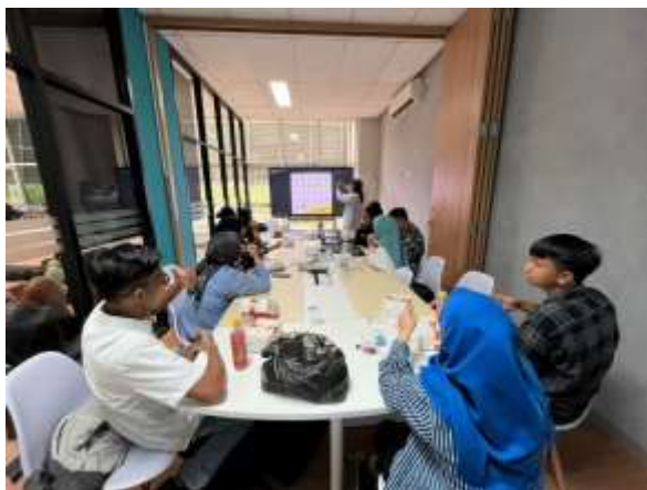
Gambar 4 Sharing Bahasa isyarat oleh Komunitas Semut Balikpapan

Setelah sesi diskusi selesai, perwakilan Komunitas Semut Balikpapan menyampaikan materi dasar terkait penggunaan Bahasa isyarat. Materi yang disampaikan berupa abjad, warna, perasaan, serta cara berkomunikasi dua arah. Setelah pemaparan materi, tim dosen melakukan simulasi berkomunikasi dengan menggunakan Bahasa isyarat.