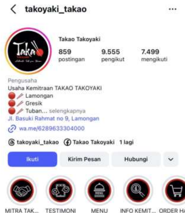
Gambar 1. Tampilan Akun Media Sosial Instagram UMKM Takao Takoyaki

Selain itu, digitalisasi pencatatan keuangan juga terbukti meningkatkan efisiensi dan kualitas informasi keuangan UMKM. Krisdiyawati dan Maulidah (2023) menjelaskan bahwa penerapan pencatatan keuangan digital pada UMKM dapat mempercepat proses rekapitulasi data, meningkatkan akurasi pencatatan, serta memudahkan penyimpanan arsip transaksi. UMKM yang masih mengandalkan pencatatan manual cenderung mengalami kesulitan dalam memisahkan antara pemasukan dan pengeluaran, menghitung laba rugi secara berkala, serta melakukan evaluasi usaha ketika terjadi fluktuasi penjualan. Oleh karena itu, diperlukan solusi pencatatan keuangan yang sederhana namun aplikatif agar dapat diterapkan secara berkelanjutan oleh pelaku UMKM.