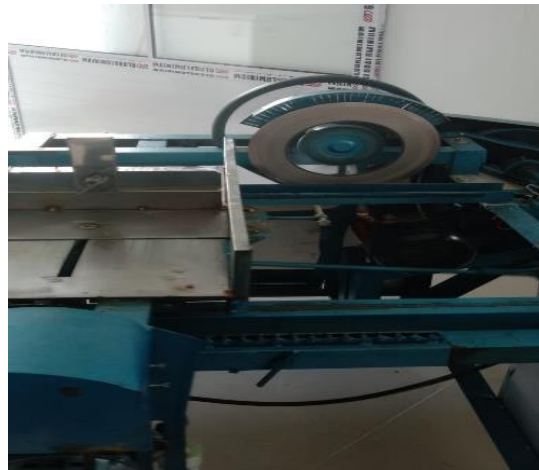
Gambar 2: Mesin Pemotong Kerupuk

Selain hasil wawancara yang dilakukan, terdapat hasil observasi yang ditemukan pada pelaku usaha kerupuk ikan di Sentra Industri Kerupuk Ikan Sei Lekop yaitu mesin pemotong kerupuk yang merupakan bantuan dari Dinas Koperasi, Usaha Mikro, Perindustrian dan Perdagangan Kabupaten Bintan dalam rangka membantu pelaku usaha kerupuk ikan.