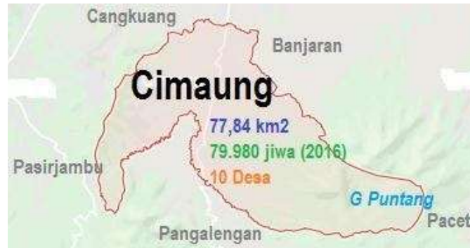
Gambar 2. Peta Lokasi Desa Cimaung

lahan kosong atau pekarangan luas belum dimanfaatkan, sebanyak 15 orang dan peserta lain yang berasal dari masyarakat sekitar.