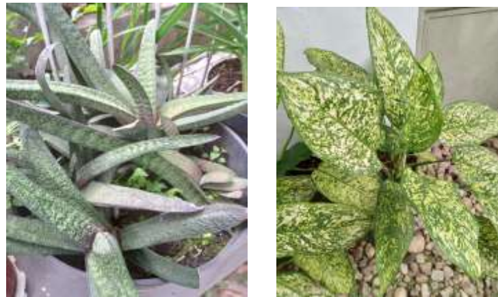
Gambar 4. Beberapa Jenis tanaman hias