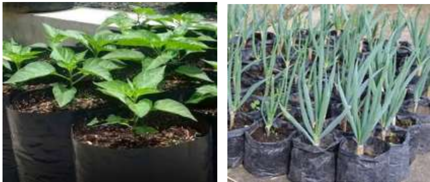
Gambar 3. Contoh tanaman cabe, daun bawang.