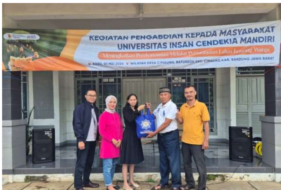
Sosialisasi Pemanfaatan Lahan Pekarangan Sebagai Sumber Kebutuhan Pangan dan Tambahan Pendapatan Masyarakat Desa Cimaung Jawa Barat