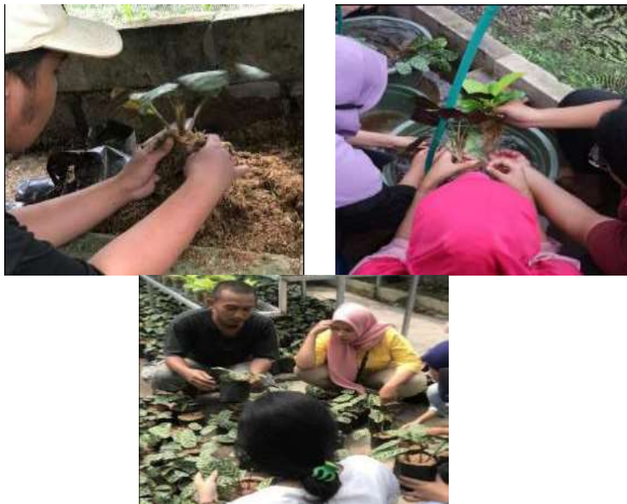
Gambar 5. Partisipasi warga belajar.

Luaran hasil sosialisasi dan pelatihan yang telah dilaksanakan pada akhir kegiatan pengabdian pada masyarakat antara adalah: