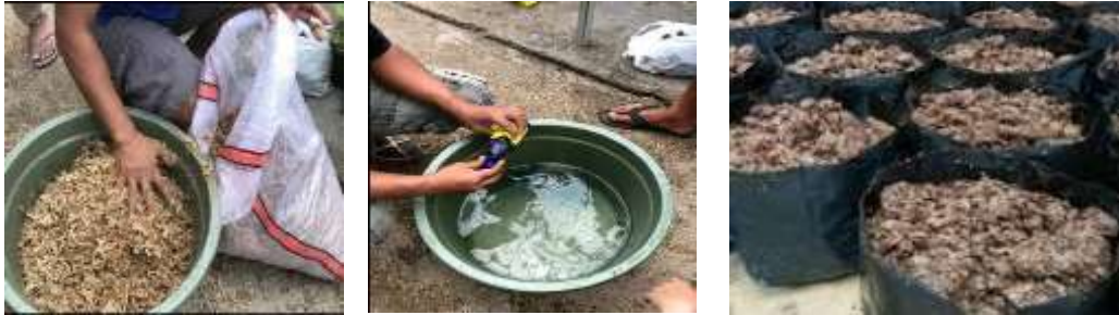
Gambar 2. Membuat/ meramu media tanaman