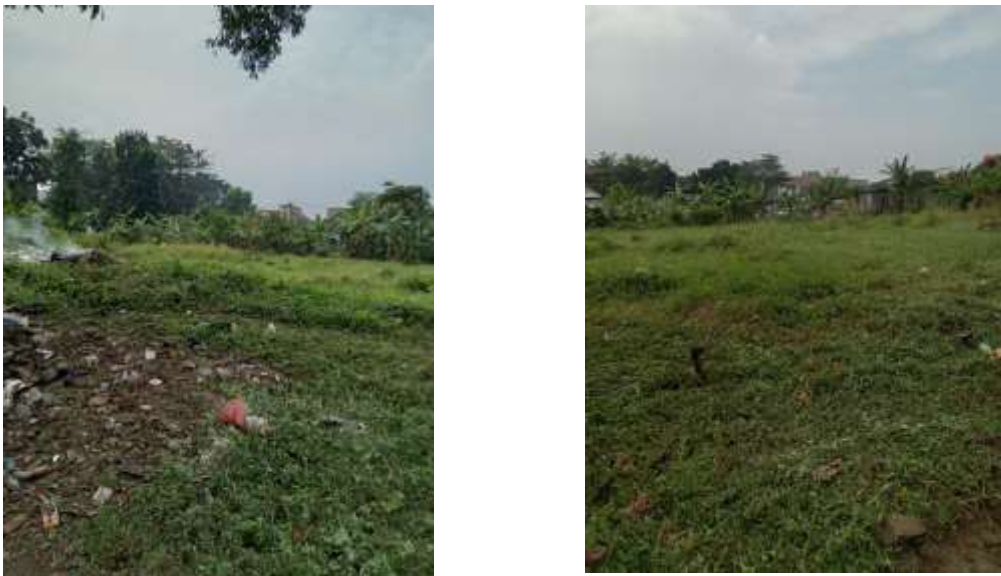
Gambar 1. Sebagian Lahan Pekarangan Warga

Berdasarkan hasil diskusi diperoleh data masyarakat desa Cimaung sebagian ada yang telah memanfaatkan lahan pekarangannya untuk tanaman keras dan masih terdapat lahan kosong yang belum termanfaatkan. Lahan pekarangan kosong warga masih bisa untuk budidaya tanaman dalam pot/polybag. menyediakan media yang akan ditanami tanaman hias atau sayuran, Permasalahan yang dihadapi penyediaan pupuk untuk tanaman. Karena itulah dalam pertemuan pertama disepakati bahwa kegiatan pelatihan nantinya difokuskan pada pelatihan penyiapan media tanam untuk budidaya pertanian dalam pot/polybag. Penanaman awal bibit tanaman berupa cabe yang telah jadi dengan membeli di toko atau kios-kios pertanian, agar tidak terlalu lama untuk sampai berbuah, demikian pula untuk jenis sayuran lainnya.