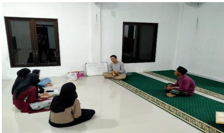
Gambar halaqah pengajar TPA

Implementasi metode asy- syafi'i pada murid TPA Al-Ikhlas dilakukan pekan ke-2. Masjid tersebut memiliki 3 jumlah pengajar TPA. Pembelajaran difokuskan kepada pengucapan makharijul huruf yang benar pada surat al-fatihah. Setiap huruf dalam sebuah ayat dibahas dengan tuntas dengan menyebut sifat-sifat yang terkandung dalam huruf tersebut.