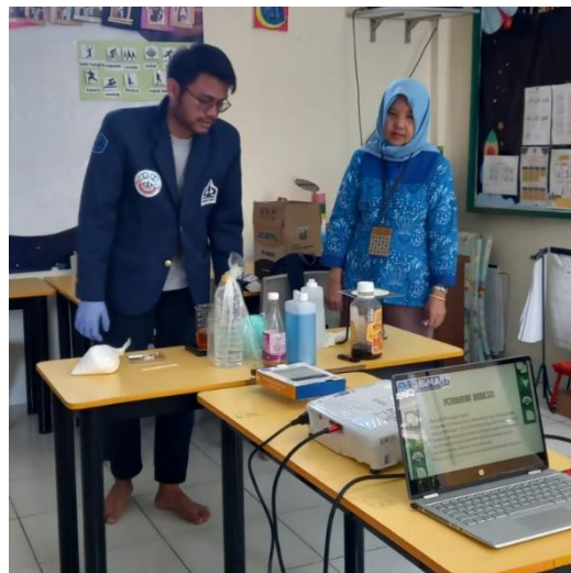
Gambar 3. Pelatihan pembuatan biodiesel

Peserta kegiatan PKM ini tidak hanya diprogramkan untuk mengikuti penyuluhan dan pelatihan saja. Namun pengetahuan dan keahlian yang mereka dapatkan diharapkan sebagai langkah awal untuk kegiatan yang bernilai ekonomi. Sehingga diharapkan warga bukan saja dapat mendukung ketahanan energi tapi juga dapat meningkatkan kesejahteraannya.