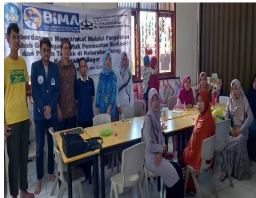
Gambar 4. Foto bersama kegiatan pengabdian kepada masyarakat sesi kedua

Berdasarkan hasil diskusi, peserta cukup memahami pentingnya menjaga kesehatan dan memiliki lingkungan bersih dengan tidak mengkonsumsi minyak jelantah dan tidak membuang minyak jelantah. Di samping itu timbul kesadaran untuk memanfaatkan minyak jelantah menjadi bahan baku biodiesel yang dapat digunakan sebagai bahan bakar pengganti minyak tanah dan lilin.