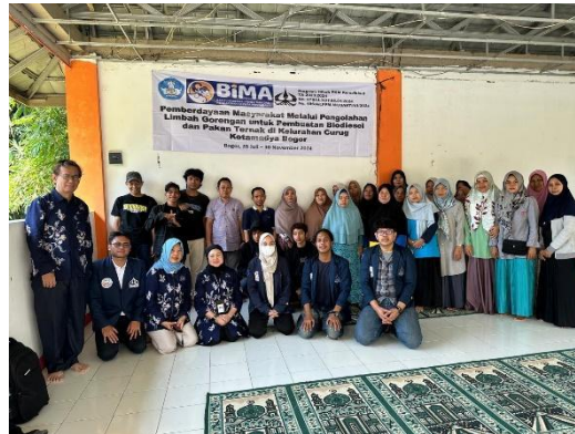
Gambar 2. Foto bersama kegiatan pengabdian kepada masyarakat sesi pertama

Tim PKM terdiri dari empat dosen dan empat mahasiswa. Dosen-dosen berasal dari Fakultas Teknologi Kebumihan dan Energi, Fakultas Teknik Sipil dan Perencanaan, dan Fakultas Ekonomi dan Bisnis. Sedangkan keempat mahasiswa semuanya adalah mahasiswa dari Fakultas Teknologi Kebumihan dan Energi.