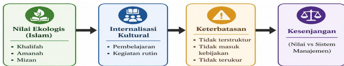
Gambar 2. Kesenjangan Integrasi Nilai Ekologis dalam Sistem Manajemen Madrasah