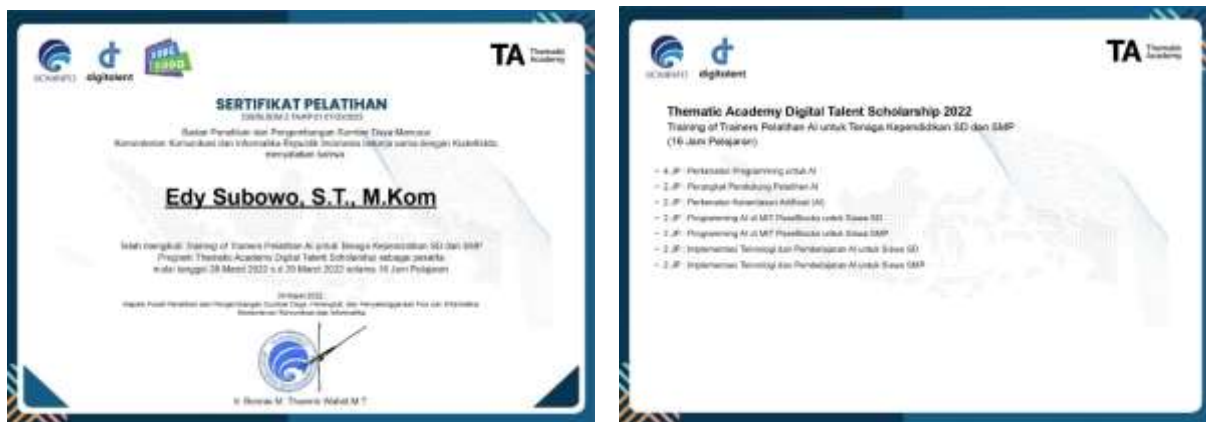
Gambar 2. Sertifikat ToT Pelatihan AI

AI pada kegiatan belajar mengajar dan mendapatkan e-sertifikat dari Kominfo. Kegiatan ini dilakukan dengan difasilitasi oleh tenaga pengajar yang bersertifikat seperti Gambar 2 berikut.