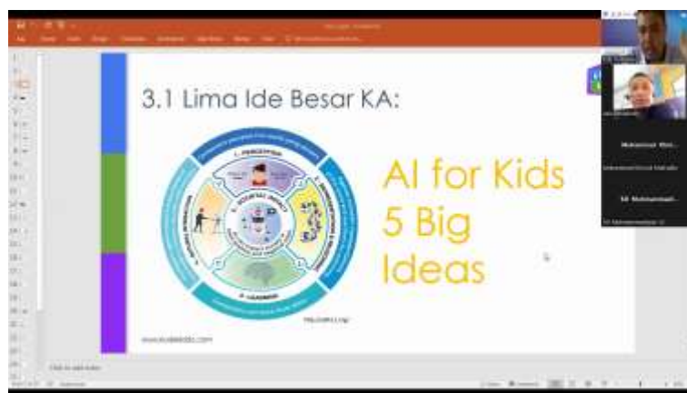
Gambar 1. Sosialisasi Program

Pelatihan ini dinilai berdasarkan tingkat kemampuan dalam membuat program sederhana dengan block programming dan memahami konsep AI dengan menggunakan demonstrasi penggunaan teknologi AI melalui pemrograman project yang sesuai untuk murid level SD - SMP. Adapun penilaian dilakukan dengan menggabungkan serangkaian metode untuk menilai kemampuan dan penerapan pengetahuan pendukung penting. Penilaian dilaksanakan sepanjang pelaksanaan workshop dengan cara: • Lisan / interaksi di kelas • Tes tertulis • Demonstrasi • Presentasi project • Metode lain yang relevan