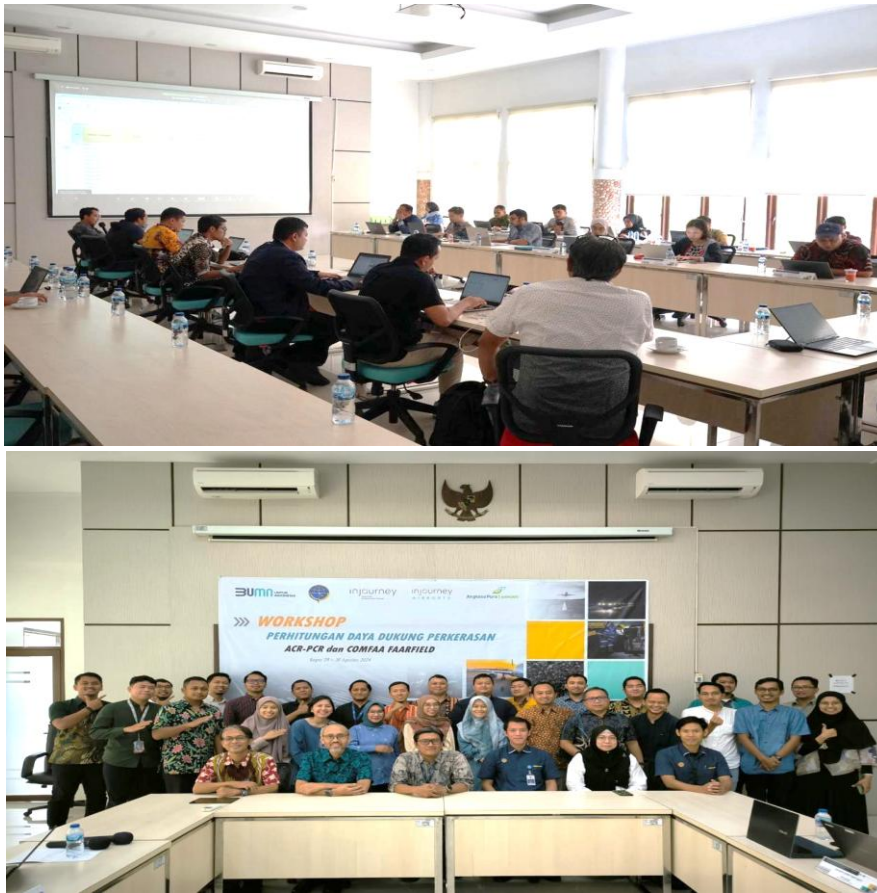
Gambar 2 Sesi foto bersama peserta