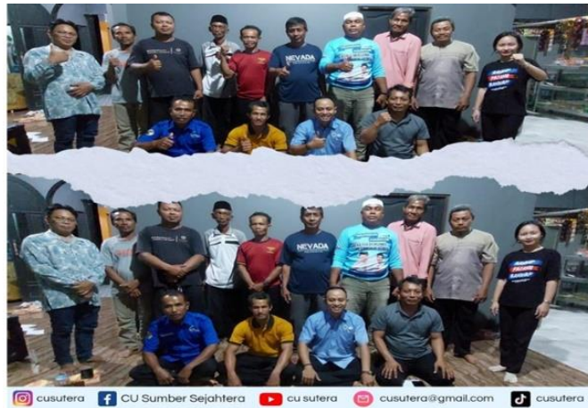
Gambar 3. Kegiatan Pengabdian Kepada Masyarakat