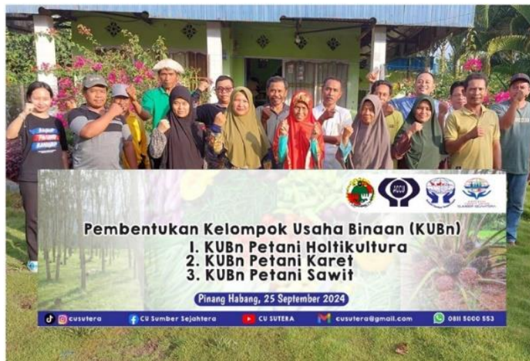
Gambar 5. Pembentukan KUB