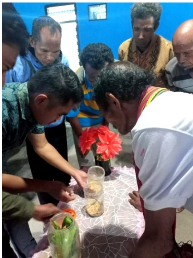
Gambar 4. Lanjutan Simulasi Penggunaan Pestisida Alami