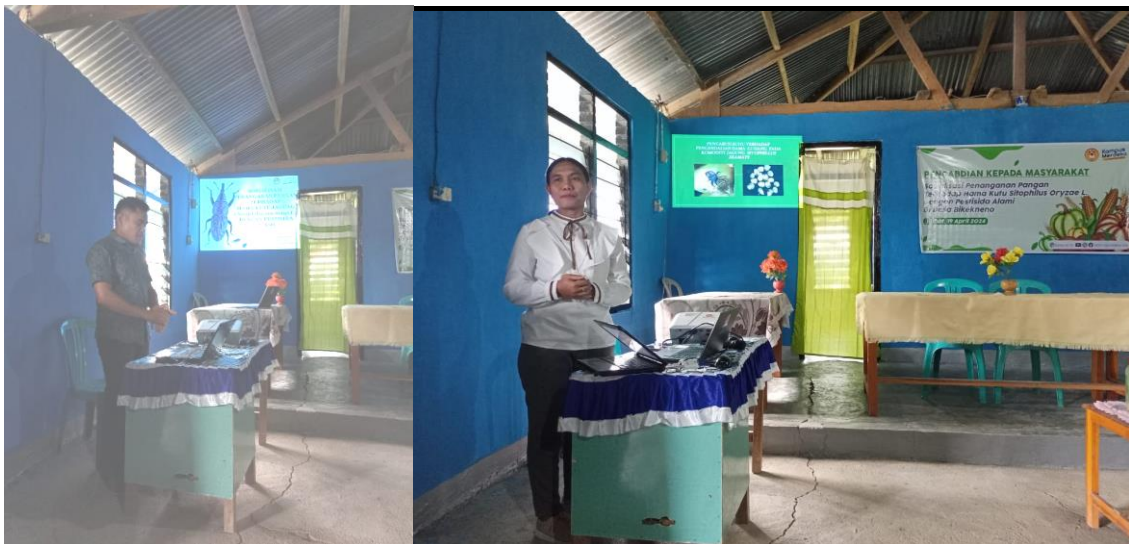
Gambar 2. Materi sosialisasi penanganan hama Sitophilus Zea mays oleh TIM

Materi sosialisasi keamanan pangan terhadap hama pangan kutu jagung Sitophilus zeamays di hunian masyarakat mencakup informasi mendasar terkait hama bawaan yang sering merugikan pangan milik masyarakat sehingga kualitas pangan menjadi rusak, gizi pangan berkurang, bahkan hasil panen menjadi tidak tahan lama ketika disimpan di rumah bulat/jerigen dan tempat penyimpanan lainnya. Materi sosialisasi yang diberikan berupa penanganan dengan menggunakan pestisida alami yakni daun tanaman pandan, daun tanaman sukun dan daun tanaman jambu biji. Gambaran materi sosialisasi dan simulasi yang diberikan dapat dilihat pada Gambar 2.