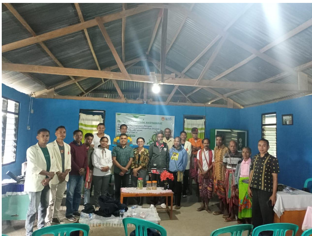
Gambar 3. Simulasi Penggunaan Pestisida alami kepada masyarakat desa Bikekno