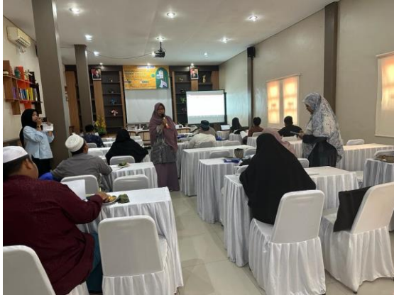
Gambar 3. Instruktur Membantu Peserta

keuangan, dan laporan arus kas. Peserta diarahkan menggunakan format sederhana sesuai standar akuntansi yang berlaku untuk organisasi nirlaba (PSAK 45). Dengan melibatkan staf keuangan pesantren secara langsung, kegiatan ini berhasil meningkatkan kesadaran akan pentingnya transparansi dalam pengelolaan dana.